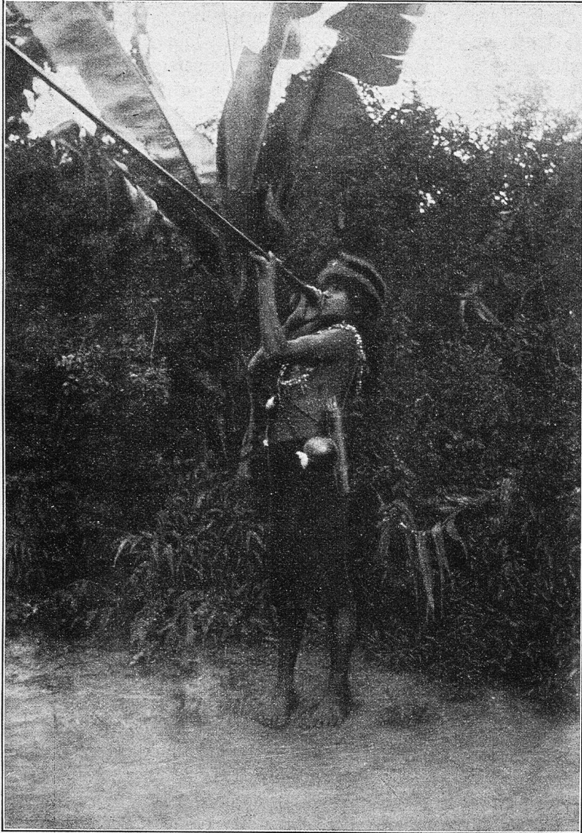
Sivaro-Indianer mit Blasrohr.

den Fische sehr schmackhaft ist, werden sie von den Südamerikanern auch gerne gegessen; in Brasilien freilich benützt man sie fast nur als Köder beim Angeln.