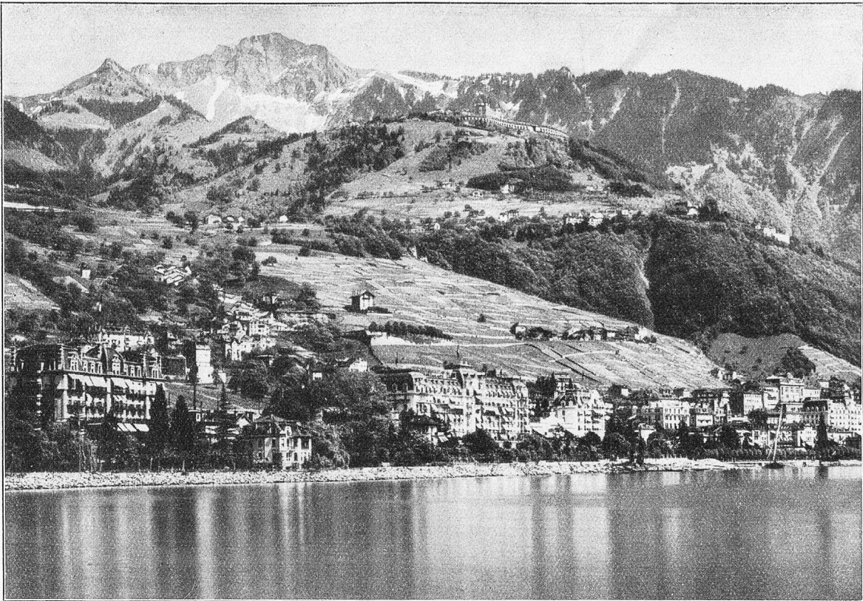
Montreux und die Rochers de Naye (2045 m)