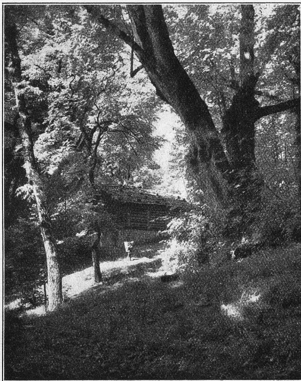
Bergwald am Brienersee.

„Noch einen Versuch werde ich jetzt machen“, dachte der Sonnenstrahl. „Ist es damit wieder