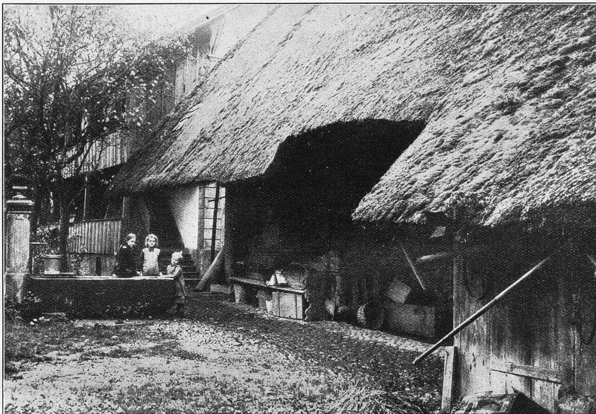
Bauernhaus in Rölliken (Aarg.).

Wenn je ein Buch an den „Häuslichen Herd“ gehört, ist es das „Schweizer Volksleben“!