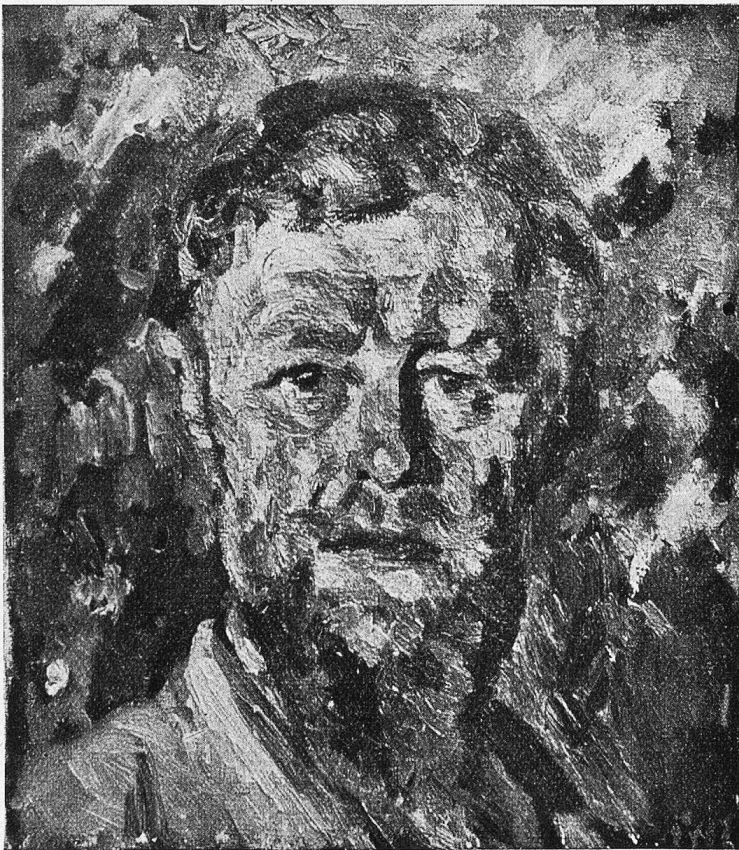
Giovanni Giacometti: Selbstbildnis.

Damit ist nicht alles gesagt. Der Malerei darf es auch gelingen, künst-