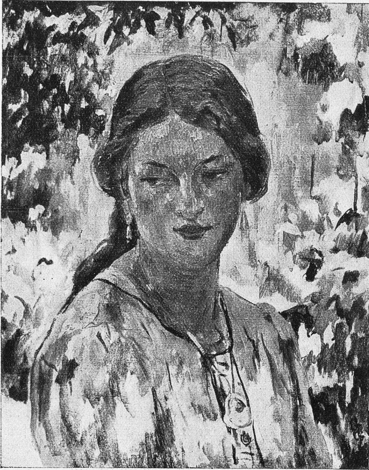
Giovanni Giacometti: Junges Mädchen.

die Bäume recken schirmend ihre Äste über ihn. Bei Licht und Sonne, bei Grün und Himmelblau ist ihm das Malen ein dauerndes Entzücken und ein berauschend fröhlicher Genuß. Anders kann es gar nicht sein. Anders wäre seine blühende Produktivität gar nicht denkbar; auch die Frische und die immer klare Tonigkeit seiner Bilder nicht, und nicht die vielfältige, wechselvolle und schier unerschöpfliche Thematik derselben; das Fesselnde und immer Beglückende seiner Kunst. So malt er Porträts, Intérieurs und Freilicht, so malt er Landschaften mit Tieren und Menschen darin, deren farbige Textur innig mit der Umgebung verwachsen ist und deren Charakteristik neben der süßen Augenweide ein starker, eigener Rhythmus in der ineinanderfließenden Bewegung der Farben und im aufteilenden Stil der Fläche ist.