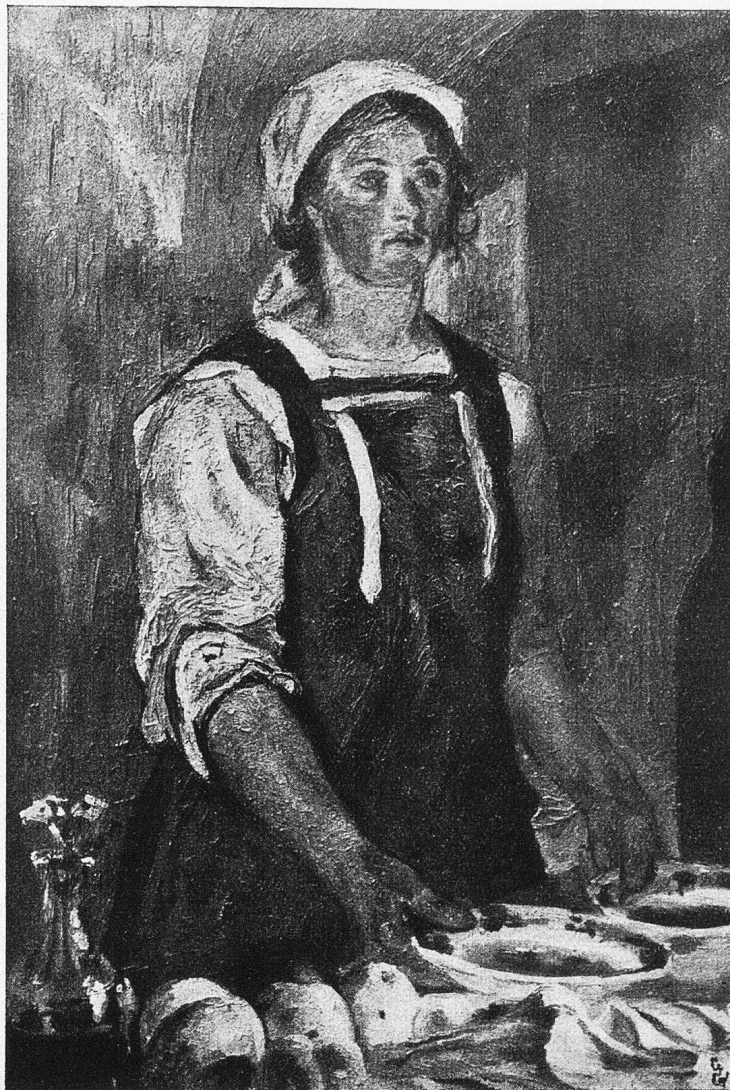
Giovanni Giacometti: Die Magd.

Dahnow las ergeben auch dies dritte Schrei-