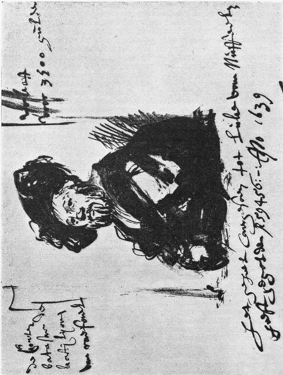
Handschrift Rembrandts (1606—1669) nebst Zeichnung.

Von unerhörtem geistlichem Format. Sie zeigt den Künstler in des Wortes letzter Bedeutung, ist irrational, blutvoll, ganz Leben, ganz Auge. Eine unerhört schöpferisch bildende, lebengebende Sanftmütigkeit, fürbittend, gemalten Schriftstücken. Künftler wie Handschrift sind gemalt, farblich fächtig empfunden, nicht literarisch. Über das Blatt hat etwas verwittertes. Die Schrift ist leidenschaftlich erregt, maßlos, uferlos. Sie hat etwas Glühendes und dabei Dummes. Bewußt verrät sich die fortschreitende Neigung zum Trunt! Die Linien verfließen mehr und mehr, werden tiefer und geduldet. Der geistliche Ausdruck der Zeichnung entspricht völlig der Handschrift.