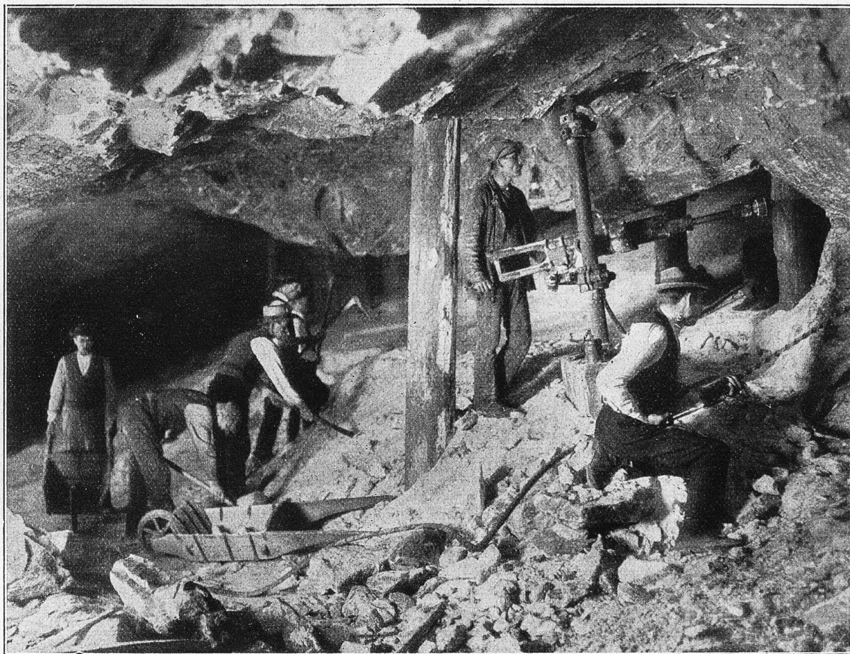
Bei der Arbeit im Salzbergwerk.