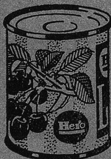
für 5-6 Personen

„Gibt es etwas Köstlicheres als unsere herrlichen in ländischen Früchte!“