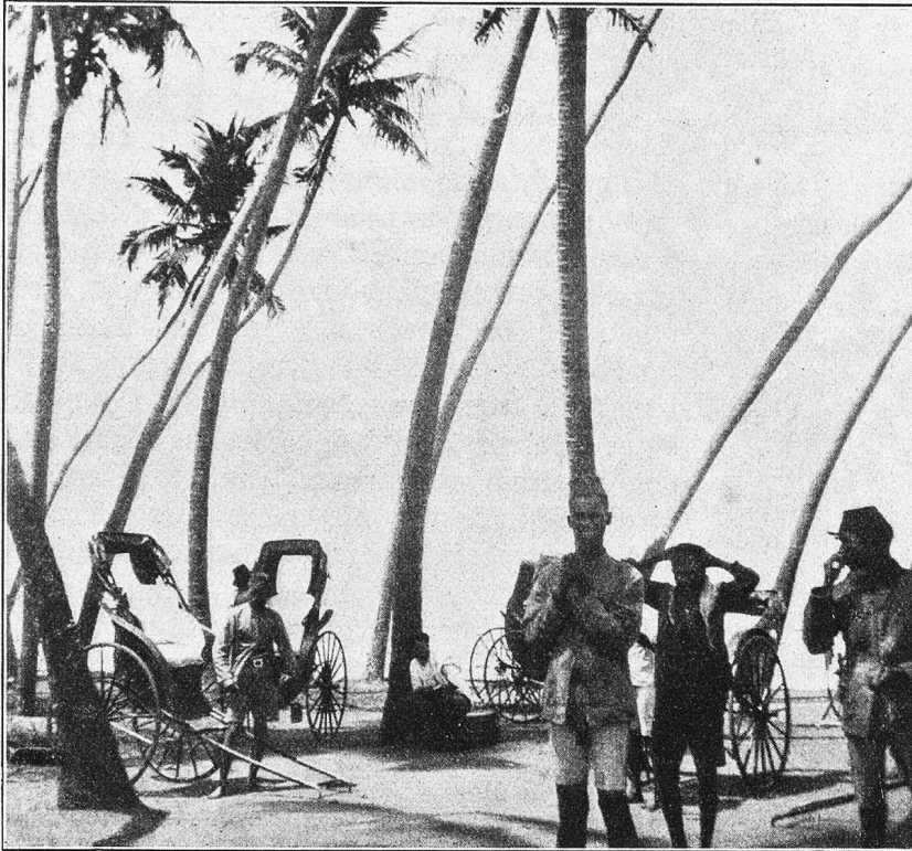
Strand bei Colombo. Kokospalmen.

wehenden Palmfächern und bei schönem Ausblick auf ein blaues Meer das Frühstück doppelt schmeckte. Auf dem Rückwege wurde ein schneller Blick in einen Buddhatempel geworfen; auf rotbrauner Straße im Palmschatten und von grünen Gärten begrenzt, darin Inländerhütten sich halb verbargen, rannte eine jugendliche Begleitmannschaft mit, die die Bettelgeberden mit dem schmeichelhaften Anruf „Water mein“ zu bekräftigen suchte. In das Geschäftsviertel oberhalb des Hafens zurückgekehrt, wurde man von den vielen Magazinen in Beschlag genommen, die Edelsteine und einheimisches Kunstgewerbe verkaufen. Rubin, Saphir und Mondstein kommen häufig auf der Insel vor, und man kauft unter Umständen gar nicht teuer manch gutes Stück; jedenfalls hat man weniger vor Fälschungen Bedenken zu tragen als vor Beschädigungen, die den Wert der Steine herabsetzen. Beim Mittagmahle im Bristol wurde man durch bettelnde Dolen unterhalten und genoß noch manches bunte Bild auf der Straße; ein Hauptvergnügen aber war, wieder einmal vom ruhenden Tische weg zu essen, was uns die letzte Vergangenheit grausam versagt hatte. Da war man gewöhnt gewesen, den Suppenteller der Balance wegen in der linken Hand zu tragen, während der Ausblick