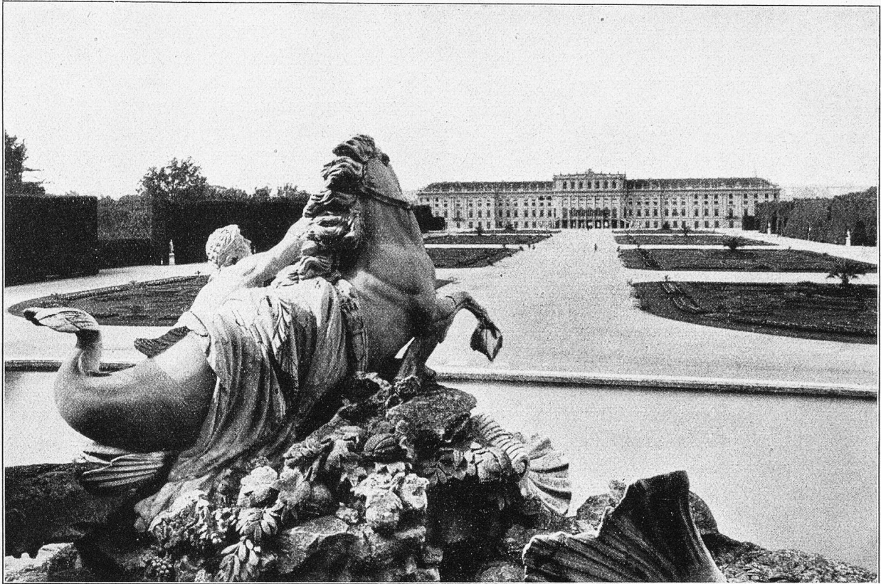
Das ehemalige kaiserliche Lustschloß in Wien.