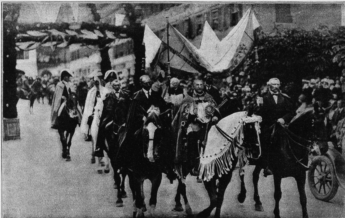
Einzug des Allerheiligsten unter dem Baldachin.

in Menge gruppiert. Unter machtvollem Glockengeläute schreitet der Zug daher. Ist der Leutpriester mit dem Sanktissimum unter dem Triumphbogen angekommen, so macht die Doppelreihe der Berittenen Halt, und es tritt eine feierliche Stille ein. Über dem Träger der Monstranz, die nun mit einem Kranz von weißen und roten Rosen geschmückt erscheint, wird von vier Berittenen ein Baldachin gehalten. Von seinem Pferde herab, das mit einem weißen, von roten Rosen umsäumten Netz festlich geschmückt erscheint, erteilt der Priester der anwesenden Menge feierlich den