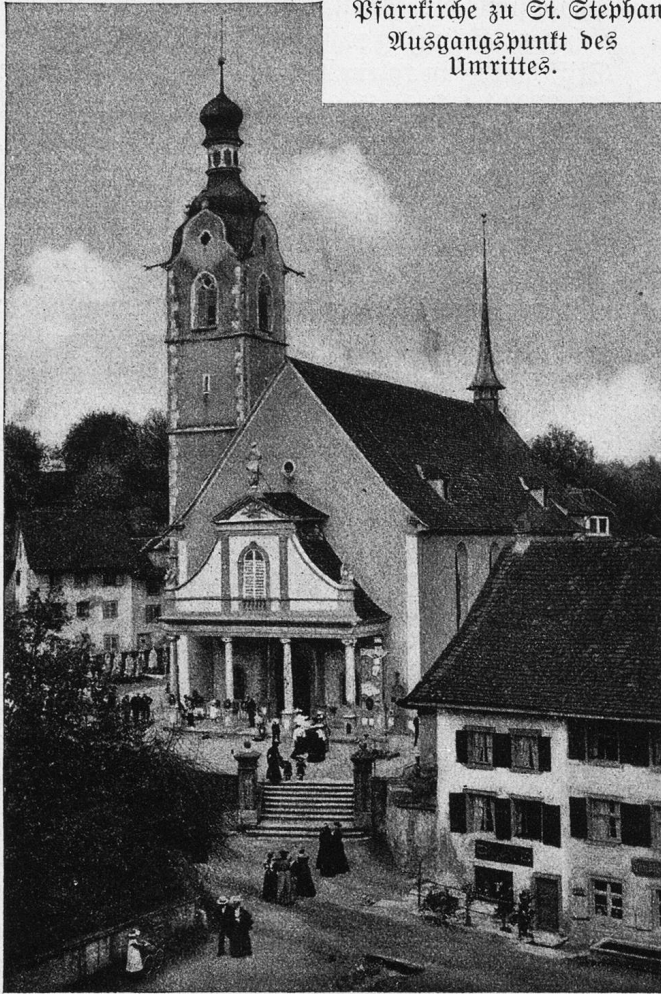
Pfarrkirche zu St. Stephan. Ausgangspunkt des Umritzes.

und hinter ihm einige der jüngern Stiftsherren, das Brevier in der Hand, ebenfalls zu Roß (angetan mit den farbigen Priestergewändern). Der Träger des hl. Sakraments ritt einen frommen Zelter, der sich in seine feierliche Rolle gut zu finden schien; auch die andern Geistlichen waren von wohlgezogenen Pferden getragen und durch treue Knechte, die nebenher gingen und auf die Tiere ein wachsames Auge hatten, schien Vorsorge getroffen, daß nicht durch unzeitige Launen derselben der Ernst des Zuges gestört werde. — Nun folgten die Kirchenvorsteher in schwarzen Mänteln, dann wieder ein Zug Dragoner, und den Schluß der berittenen Wallfahrt bildeten die Kofse einzelner Bürger des Fleckens und der Umgebung, zum Teil auch in schwarze Mäntel gehüllt. Schon am Morgen konnte man 150 bis 160 Pferde zählen, einzelne auch von Knaben geritten; ihnen folgte eine weit größere Menge von Fußgängern, teils in geordneten Reihen, ihren Rosenkranz betend und in die Gesänge einstimmend, teils aber auch aus Neugierde oder Interesse an dem seltsamen Schauspiele