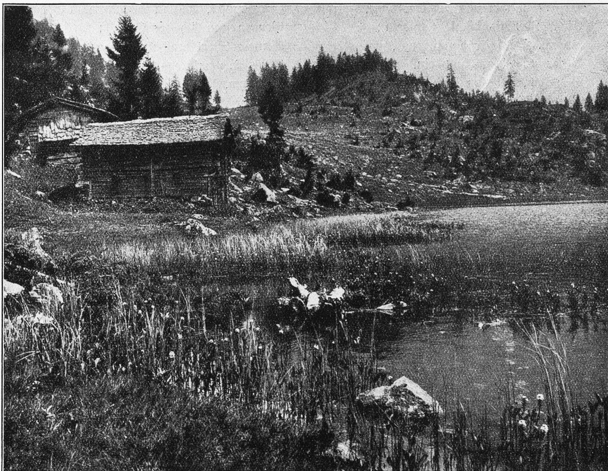
Am Solzerensee im Maderanertal (Uri).