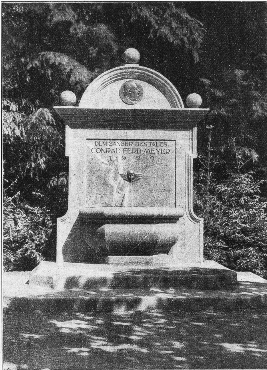
C. F. Meyer-Brunnen in Engelberg.