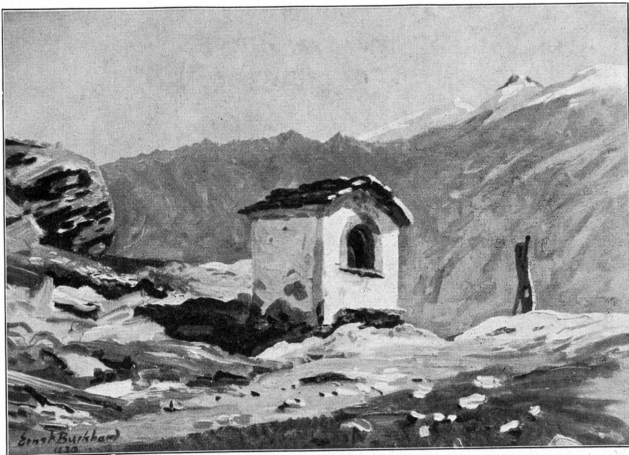
Am Kapellenweg in Saas-Fee.

Nach einem Gemälde von Ernst Burckhard, Richterswil.