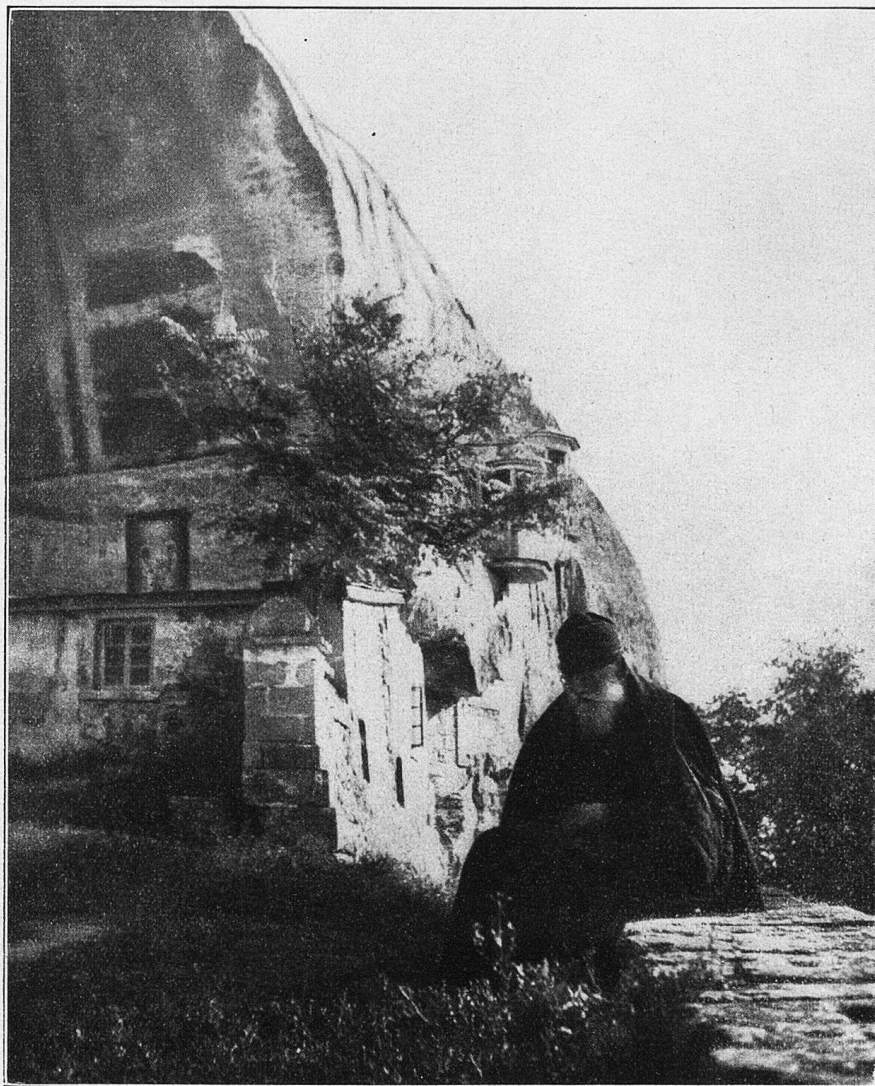
Einsiedler. Obwohl seine Klause zerstört wurde, ist er doch an dem Ort geblieben und lebt von Almosen mildtätiger Tartaren.

Auf ein solches Schiff hat sich der Hiesel ver- dingt, weil sein Wanderpfennig aufgezehrt war und weil er wissen wollte, wo die Sonne dann am andern Morgen auf und niedergeht. Die Tagesleuchte aber tauchte aus unübersehbaren Wässern, worin das Waldbüblein mit vielen