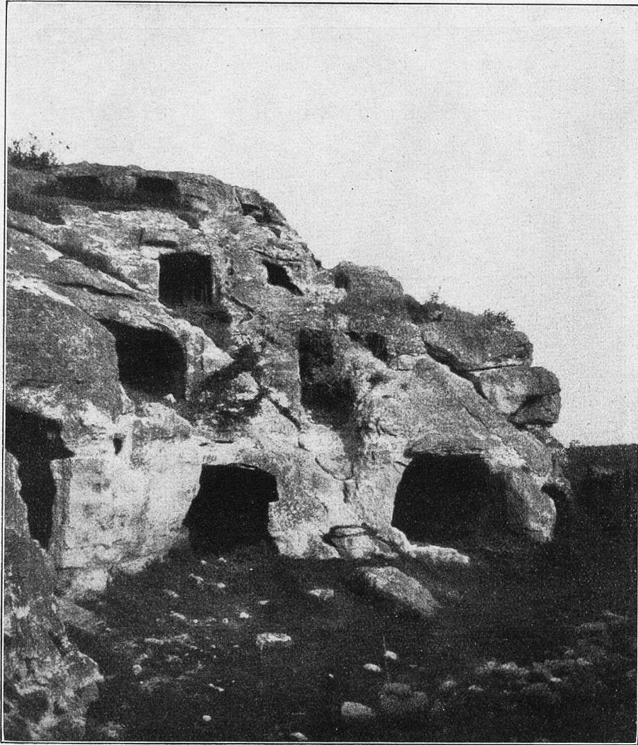
Höhlen in Tschufut-Kale.

eine Nacht lang ohne Ursache die Haustüre an, und weil in derselbigen Nacht auch die Wanduhr stehen blieb, obwohl sie frisch aufgezo- gen war, so wußten sie auf dem Hieselhieselhofe, daß der Vetter in Amerika gestorben war und sich daheim noch angemeldet hatte. Sie gedach- ten des Toten, wie es Brauch ist, mit einer See-