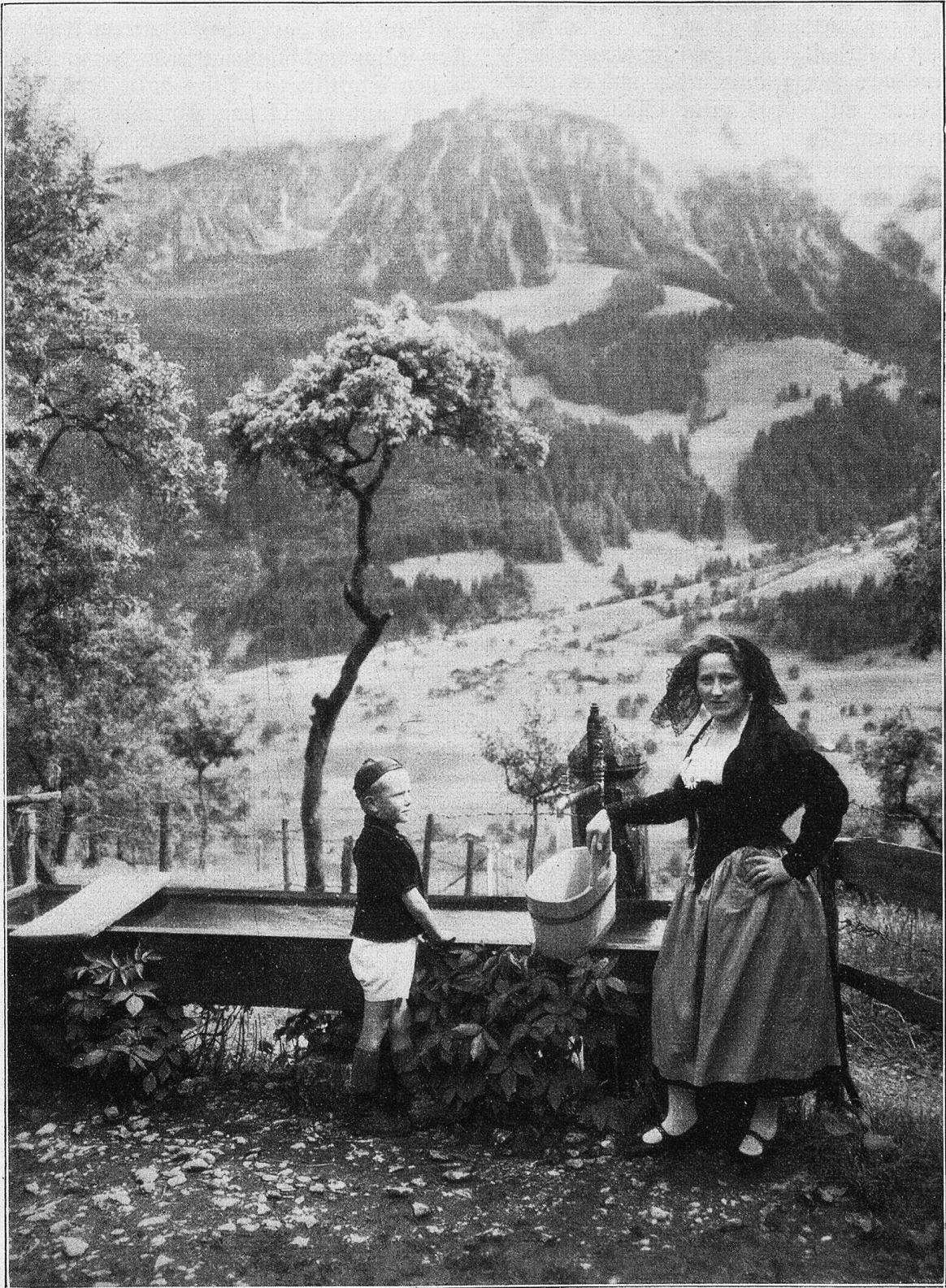
Simmentalerin aus Weißenburg.