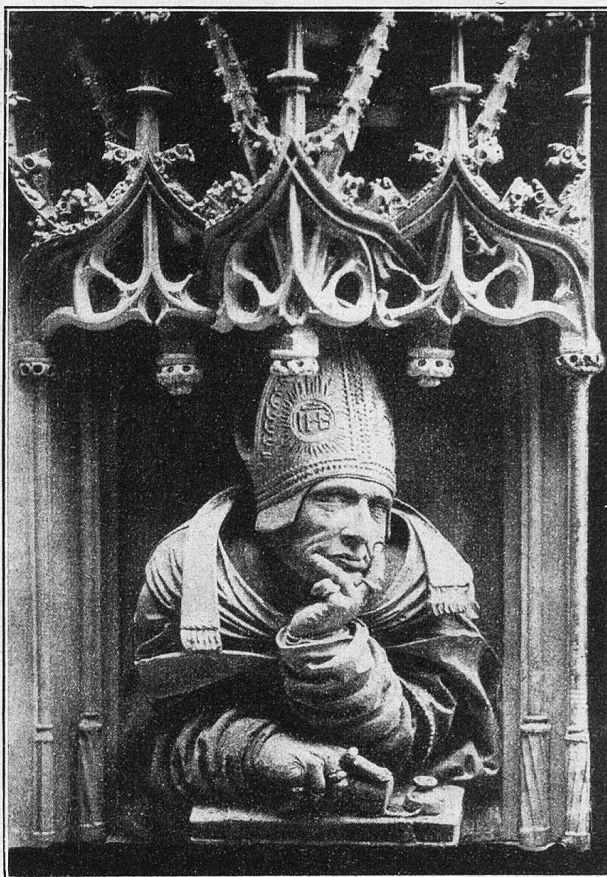
Wien. St. Stephan. Kanzel, Büste eines Kirchenlehrers.

Derlei Altäre, Baldachine, Epitaphe, Kapellen, Emporen, Grabmale, Statuen, Gestühle, Galerien wären noch viele aufzuzählen. Noch wäre von den Toren zu sprechen, vom Sängertor, vom Bischofstor, die in die Kirche führen, vom Adlerturm, der um 1511 abgebrochen wurde, vom Zahnwehhergott, von den Wasserspeiern, von der Capistran-Kanzel, vom goldenen Adler an der Spitze des Turmes, von den Tafelinschriften, die sich vorne an der Hauptfront des Domes finden; und vor allem von der gewaltigen Pummerin, einer Glocke, die nicht weniger als 19,800 Kilogramm wiegt und um 1711 von Johann Achamer aus dem Metall erobertes türkischer Kanonen gegossen wurde: ja, von all dem könnte noch mancherlei gesprochen und erzählt werden: der Raum erlaubt es nicht. Und manch eine Sage und Legende knüpft sich an den Dom und an die Baugeschichte dieses Domes. So gehe jeder, den der Weg nach Wien