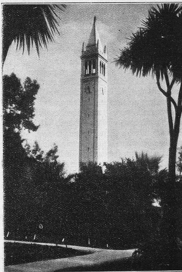
Der Turm der Universität von Californien.

Und durch diese Fülle von Hallen und Gängen wogt ununterbrochen bewegtestes Leben, flutet auf und ab, kaum eine Minute vergeht, in der hier kein Zug einläuft oder abgeht. Aber — und auch dies ist eine Eigentümlichkeit, deren Erwähnung zu tun man nicht vergessen darf —, alles, was hier geschieht, vollzieht sich mit einer geradezu unheimlichen Ruhe. Trotz der Vielzahl der Menschen liegt über dem ganzen Betrieb eine wohlthuende Stille, man hört kein lautes Wort, keinen Ruf, kein Schreien. Einer nimmt auf die Nerven des anderen Rücksicht, und so kann man sich hier genau so gesammelt fühlen, wie sonst vielleicht nur noch in einem Gotteshaus. Und dies ist gut so; denn dünkte man sich den hier ständig in Fluß befindlichen Menschenstrom aller Klassen und Rassen als wildschreiende und gestikulierende Masse — eine Irrenanstalt wäre nichts gegen den Grand Central und eine normale Abwicklung des gigantischen Verkehrs ganz unmöglich.