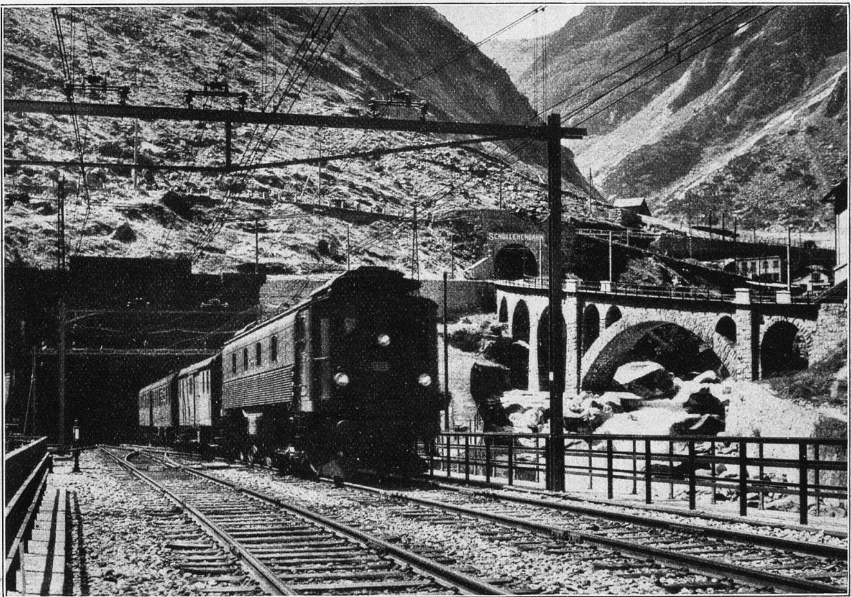
Am Nordausgang des großen Gotthardtunnels bei Göschenen.