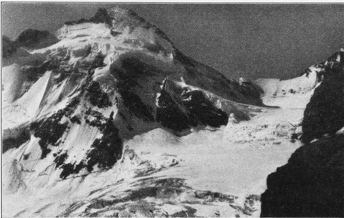
Blick vom Stockje gegen Dent d'Hérens.