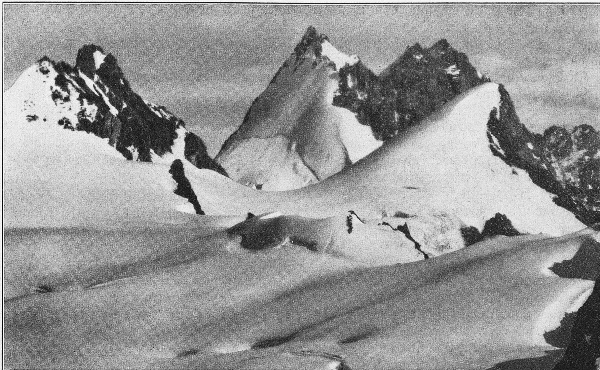
Les Bouquetins von der Bertolhütte aus.