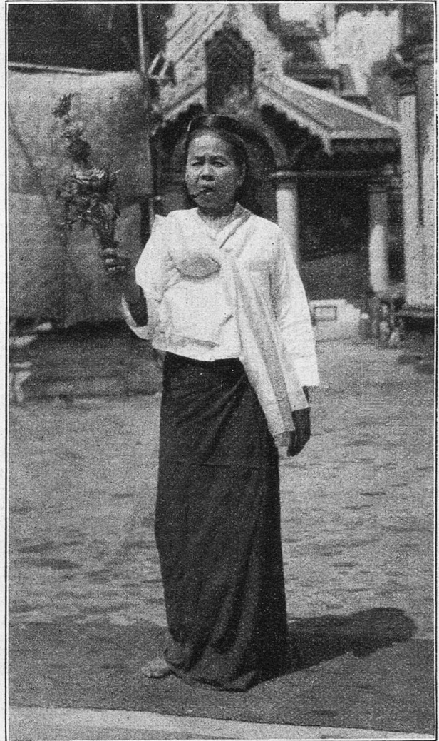
Shwe-Dagon Pagode. Rauchende Wallfahrerin.

lassen, der nur einen schmalen Eingang hatte, worin das fängisch gestellte Eisen eingegraben lag. Im Innern des Verhaues wurde jeden Abend ein Schaf befestigt. Wollte der Leopard zu diesem gelangen, so mußte er sich durch den