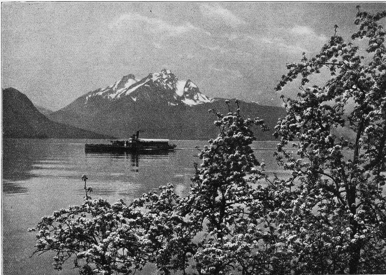
Frühling am Vierwaldstättersee. Blick gegen den Pilatus.