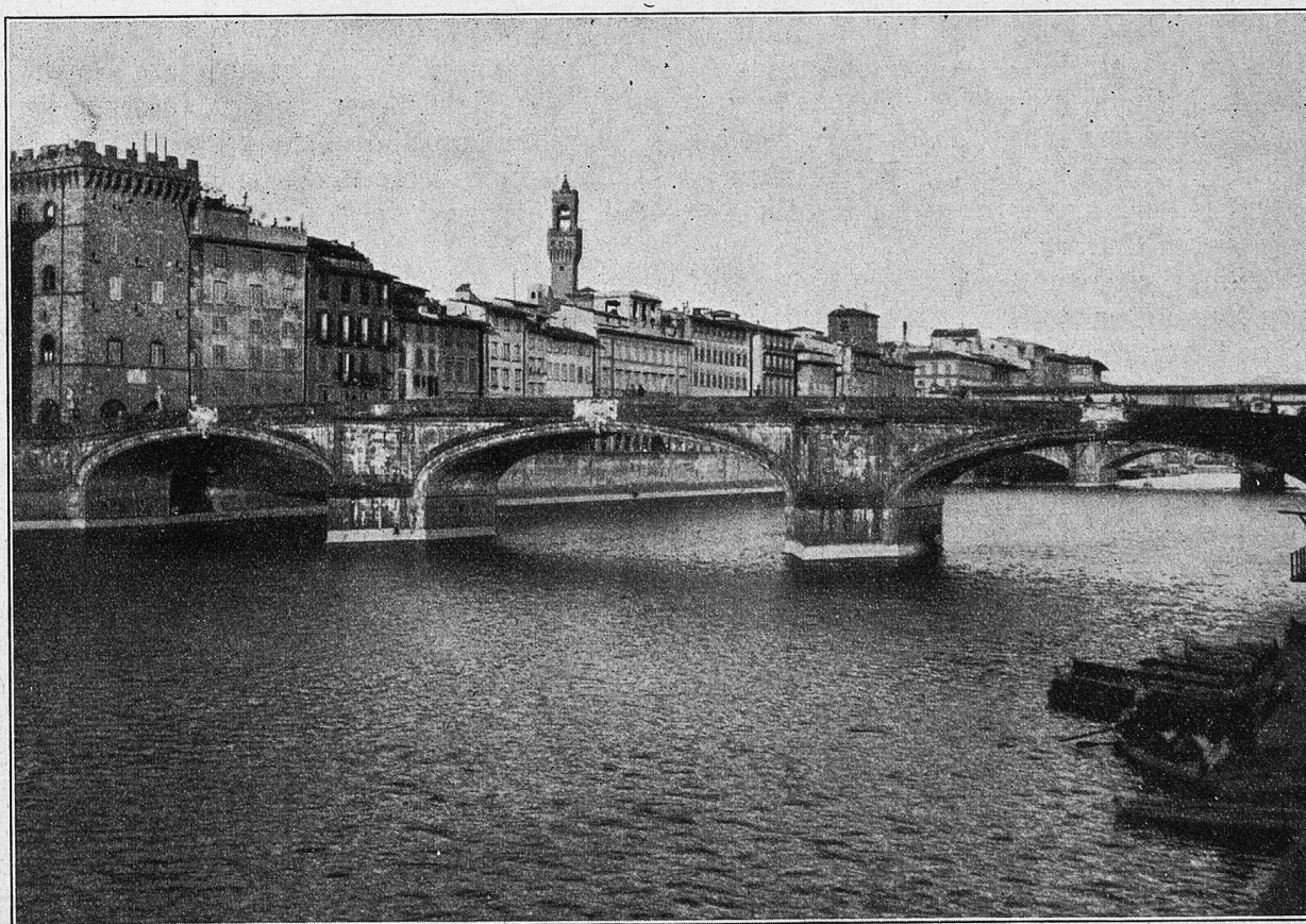
Florenz. Die elegante Trinita-Brücke.

Duskonti war schon mit seinen Leuten den Berg weit heruntergekommen, bevor er — beim schwachen Morgendämmern — entdeckt werden konnte. Die Fliehenden liefen in das große Amtrouk-Tal und stießen in einem Hohlwege mit einer Patrouille französischer Hilfsstreitkräfte zusammen. Somit war der Fluchtversuch mißglückt, und es blieb Duskonti und seinen Leuten nichts weiter übrig, als — unter der schwersten französischen Granatfeuer — den Weg zurück in die Berge zu nehmen.