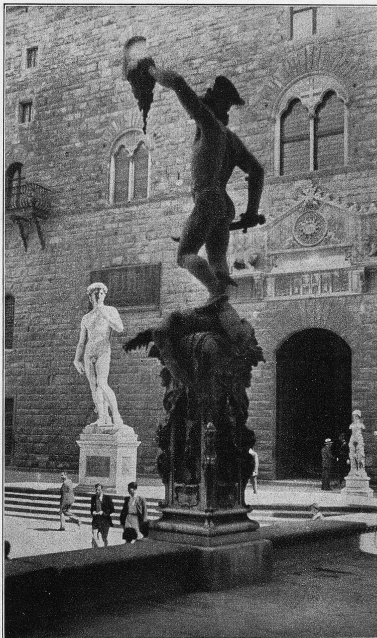
Florenz. „Perseus“ von Cellini in der Loggia dei Lanzi.

Beim morgendlichen Dämmerchein kamen die grimmigen Gebirgler, von Fels zu Fels huschend und nur eben wahrnehmbar in ihrer