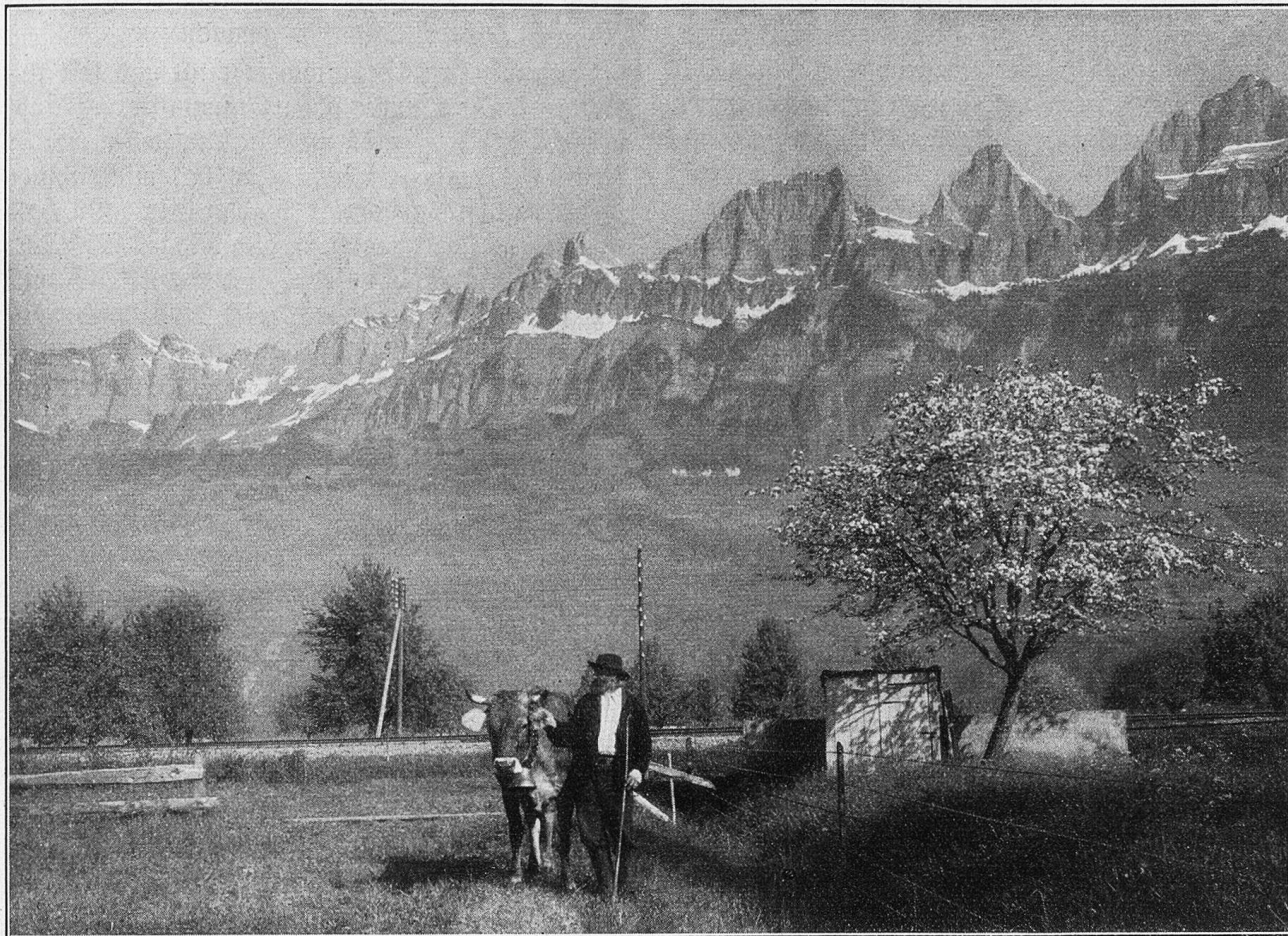
Kurfirten bei Wallenstadt.