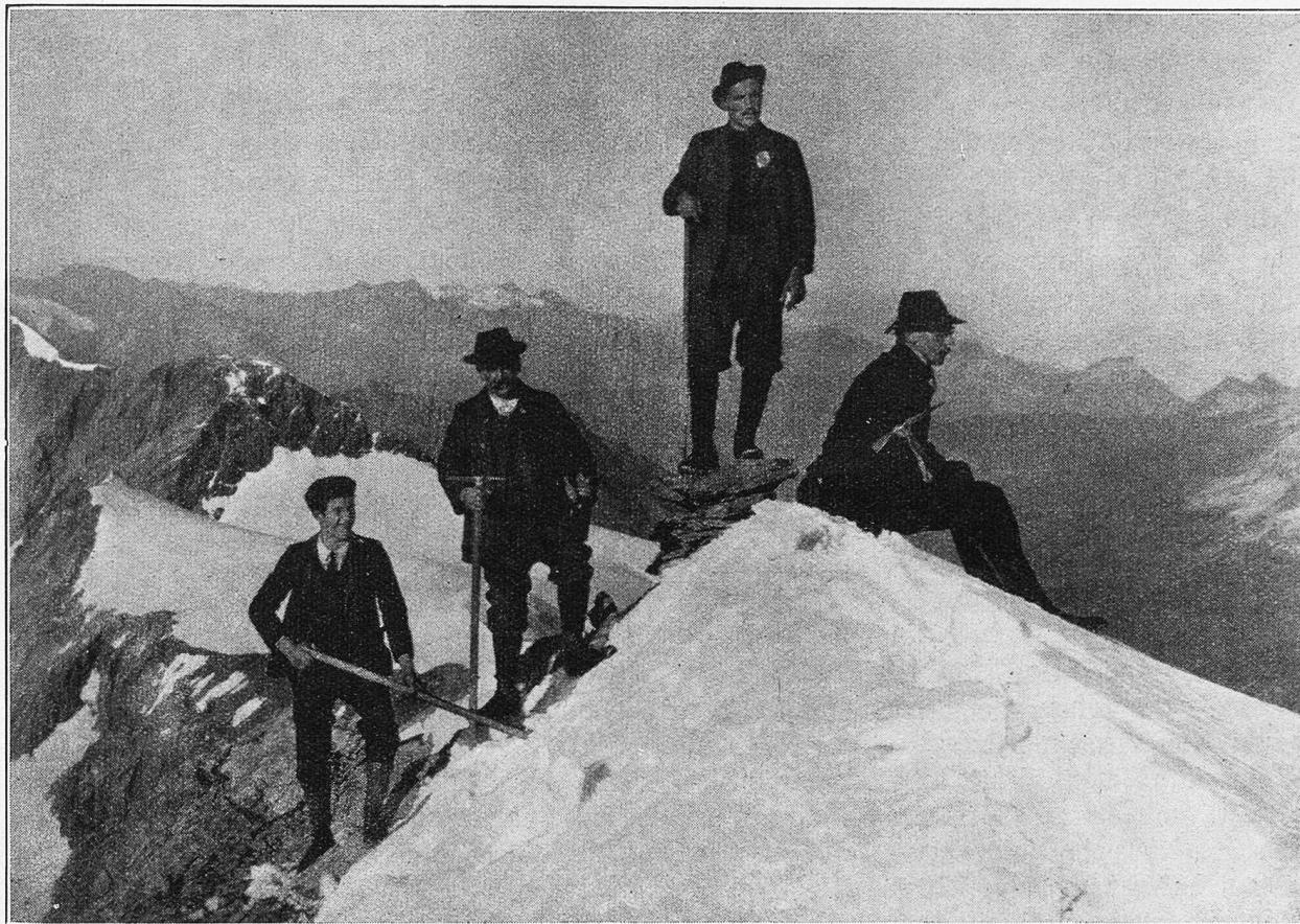
Auf dem Claridenstockgipfel angelangt (3273 m).