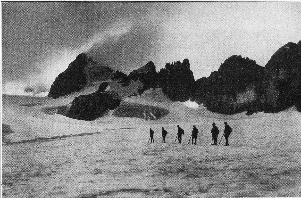
Bockschängel und Teufelsstöcke.