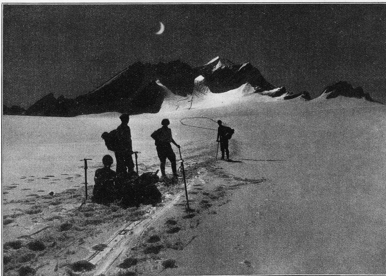
Früh beim Mondschein wird aufgebroschen.