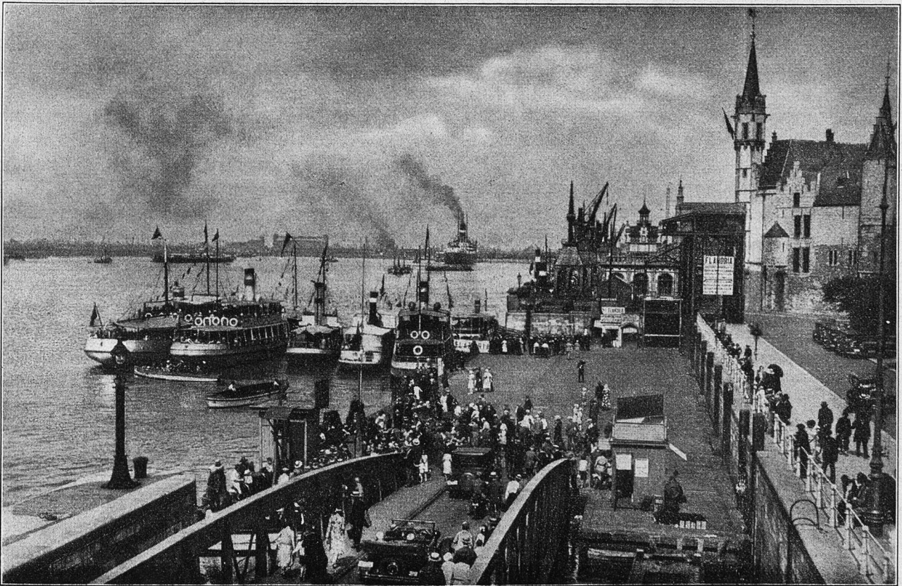
Im Hafen von Antwerpen.

Antwerpen ist groß geworden durch seine Lage an der Schelde. Die Breite des Stromes beträgt an etlichen Stellen über fünfhundert Meter. Fähren, die stets in Bewegung sind, verbinden die flachen Ufer. Von den Terrassen aus verfolgt