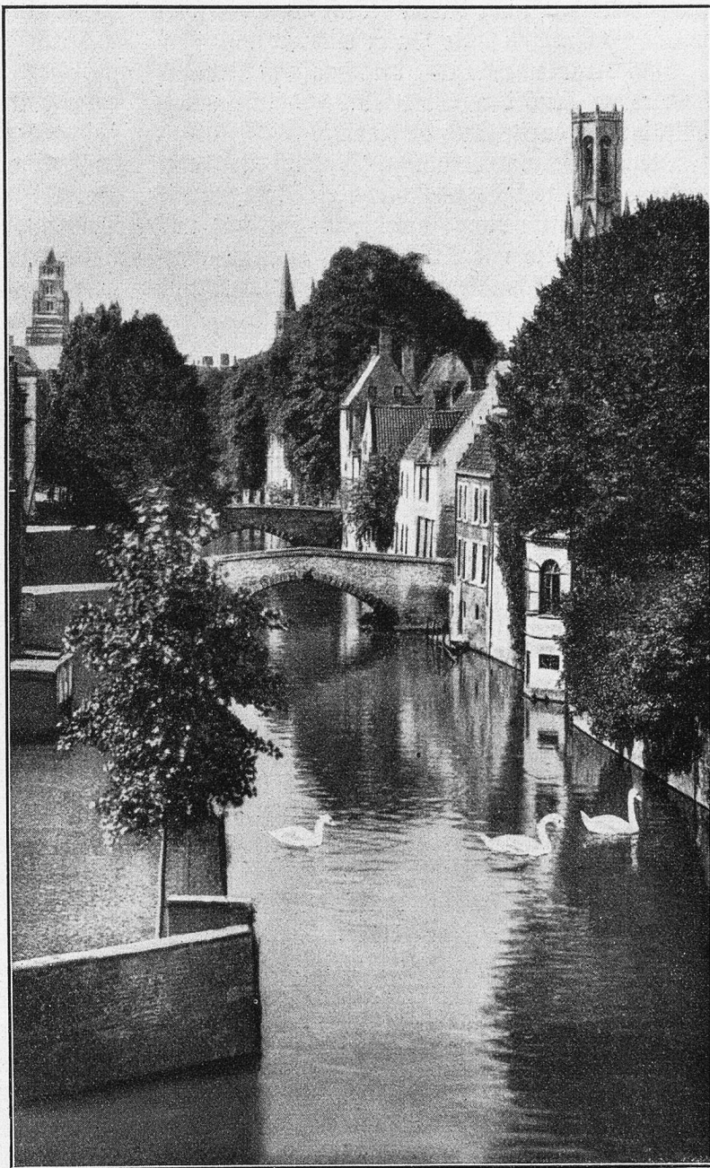
Brücke: Am grünen Quai.