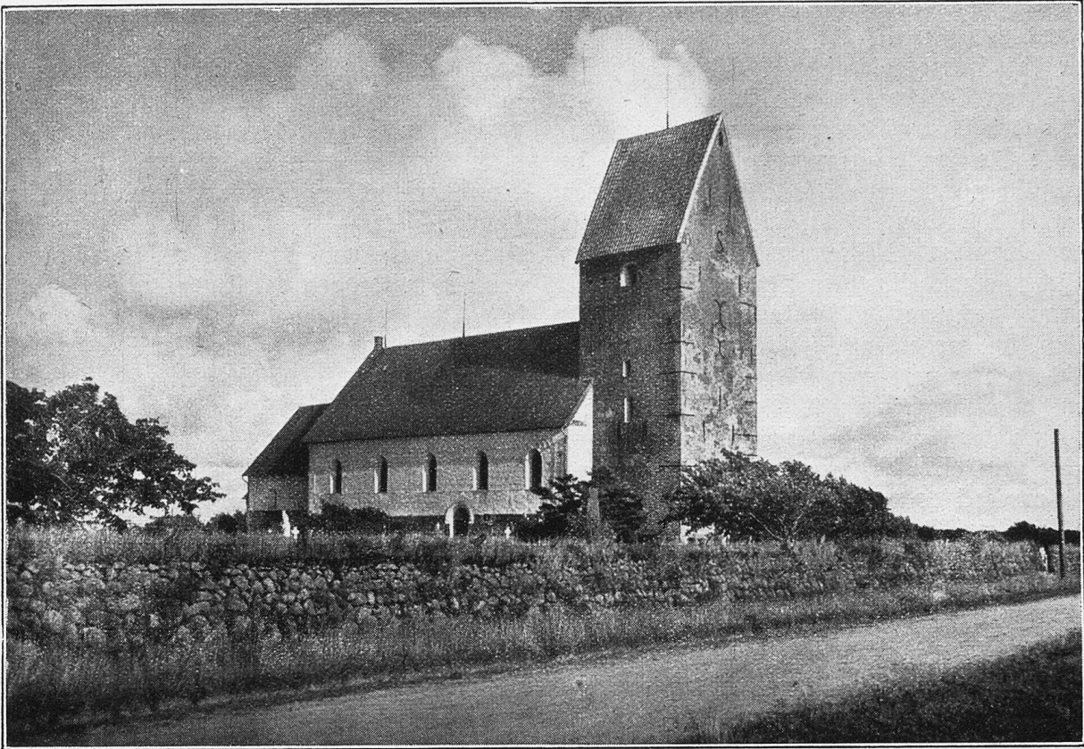
Sylt. Kirche in Keitum.

doch ruhig, höflich, gelassen und flink sein muß, und man wird wissen, was man geleistet hat. —