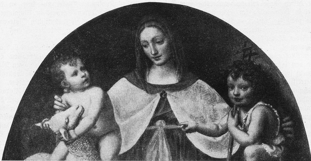
Bernardino Luini: Madonna. (Santa Maria degli Angioli in Lugano.)

leider stellenweise erloschenes Christophorusbild. Im allgemeinen haben die Kirchen des Blenio-tals ihr romanisches Gewand weniger erhalten als die der Leventina; manch Wertvolles ist barocker Restauration zum Opfer gefallen.