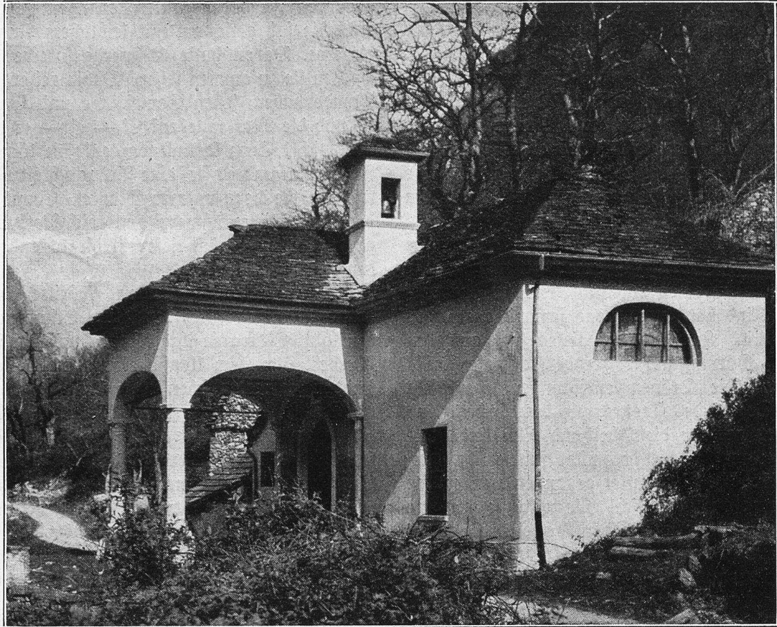
Wegkapelle im Babonatal.

deren Können die bedeutendsten Städte Italiens: Rom, Genua, Venedig, Neapel, Mailand, Turin, Como usw. mit hervorragenden Kunstwerken schmückten, auch große italienische Künstler kamen in unser Land, um hier Zeugnis von ihrem unvergänglichen Wirken zurückzulassen. Von den erstern sei vor allem Domenico Fontana, der 1534 in Melide geborene geniale Meister genannt, der die herrliche Fassade des Lateran-Palastes in Rom und den Apostolischen Palast errichtete; ferner eine Reihe hochgeschätzter privater Paläste. Auch die Aufrichtung des gewaltigen Obelisken vor dem Petersdom ist sein Werk. Im Dienste der spanisch-neapolitanischen Regierung schuf er später auch in Neapel bewundernswürdige Werke und starb als ein Meister von europäischem Rufe.