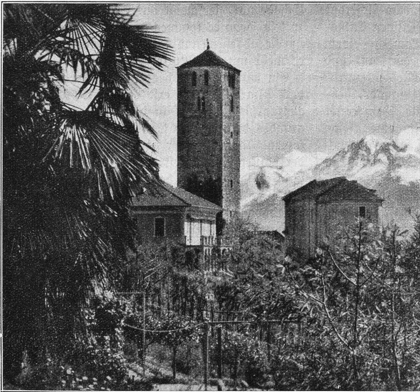
San Quirico bei Locarno.

Ich schritt nun wieder hinaus in das gedämpfte Licht eines südlichen Regentages und suchte einen trockenen Unterschlupf auf, den ich denn auch unter der geschützten Terrasse eines kleinen Cafés fand. Die Fremdheit der Umgebung und der melodische Klang der Sprache machten mich aufmerksam und empfänglich für alles, was um mich geschah.