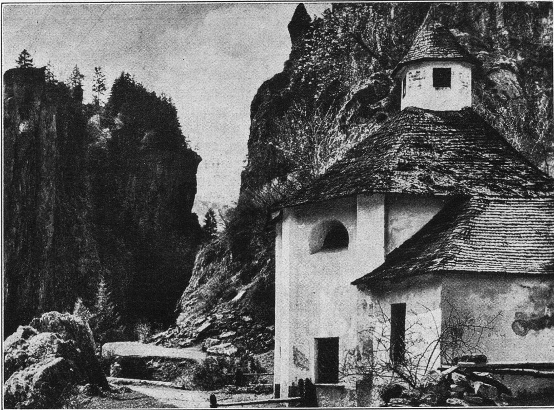
Bergkirchlein in der Leventina.

„Ihr wißt doch,“ fuhr er fort, indem er sich die unentbehrliche Zigarette anzündete, „daß ich letztes Frühjahr nach Italien fuhr, um im Auftrage einer Stiftung das Altarbild der heiligen Catharina in Siena zu kopieren. Ich kam an einem trüben, regnerischen Nachmittag dort an, und mein erstes war, mein heiliges Modell aufzusuchen, dem ich auf Gnade und Ungnade mehrere Wochen ausgeliefert sein sollte. Der Küster führte mich durch die Sakristei in eine kleine Nebenkapelle, in der ich über dem Altar das bewußte Bild, die heilige Catharina darstellend, zu Gesicht bekam.