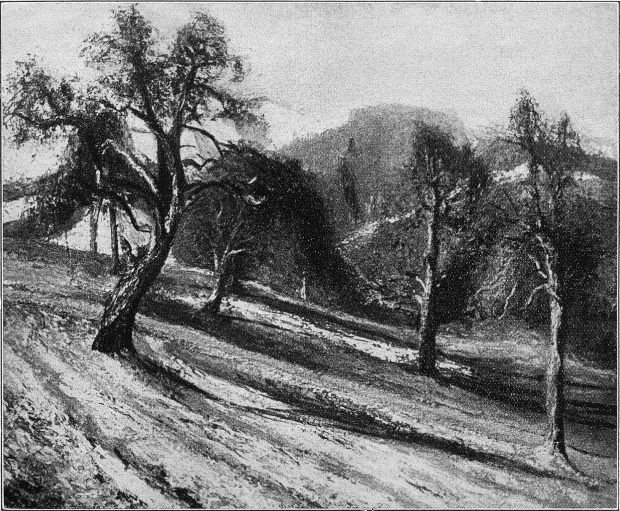
Landschaft bei Hirzel (Kt. Zürich).

Nach einem Gemälde von Reinh. Kündig, Hirzel.