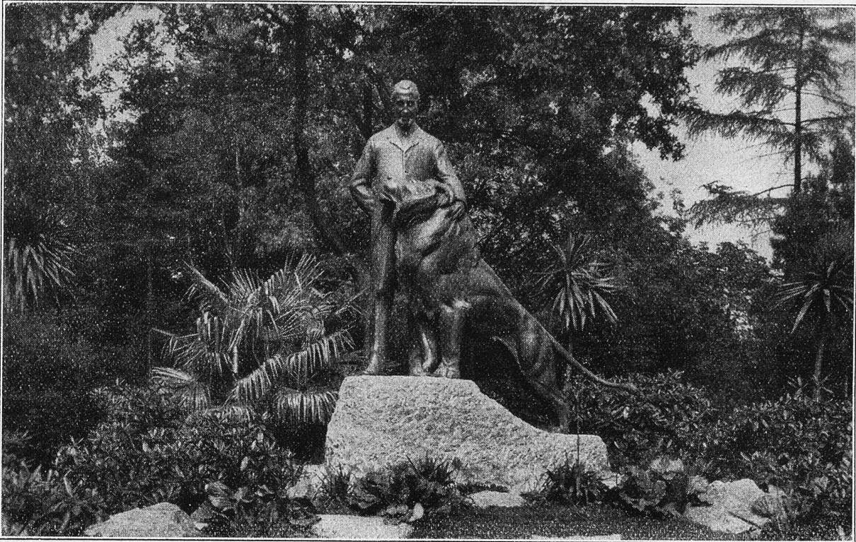
Denkmal Carl Hagenbeck.