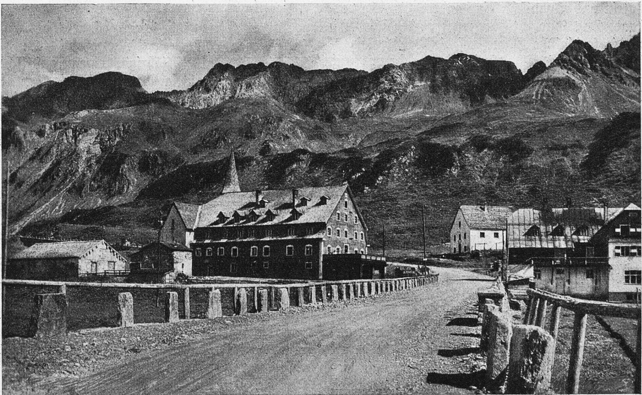
St. Christoph am Arlberg (1800 m).

Der Mann mit dieser erstaunlichen Sprachkenntnis war der erste Kustode der vatikanischen Bibliothek und spätere Kardinal Giuseppe Gasparo Mezzofanti, eines der größten linguistischen Genies, die je gelebt haben. Über siebenzig Idiome sprach er gegen Ende seines Lebens mit