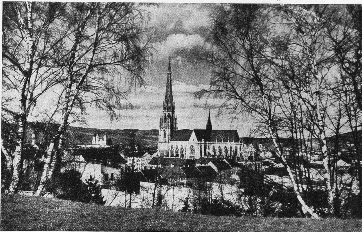
Linz a. d. Donau. Maria-Empfängnis-Dom.

Sphäre der Kunst und ließen uns wieder einmal staunen, was für eine schöpferische Macht im ungebrochenen Glauben steckt und wie dieser in einer triumphierenden Fröhlichkeit den Himmel so irdisch und die Erde so himmlisch durchdringen und bestrahlen kann.