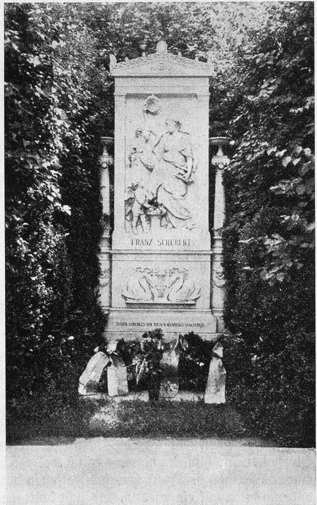
Zentralfriedhof. Franz Schuberts Grab.

Aber es steht doch in meinem Führer, sage ich. Ich habe den dicken Führer zwar nicht mitgenommen und die Straße vergessen. Ich hatte es mir so leicht vorgestellt. Man geht hinter dem Haydn-