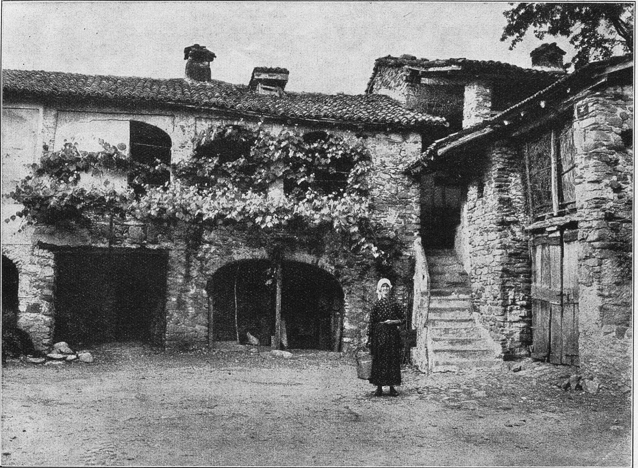
Typischer Tessiner Hof.