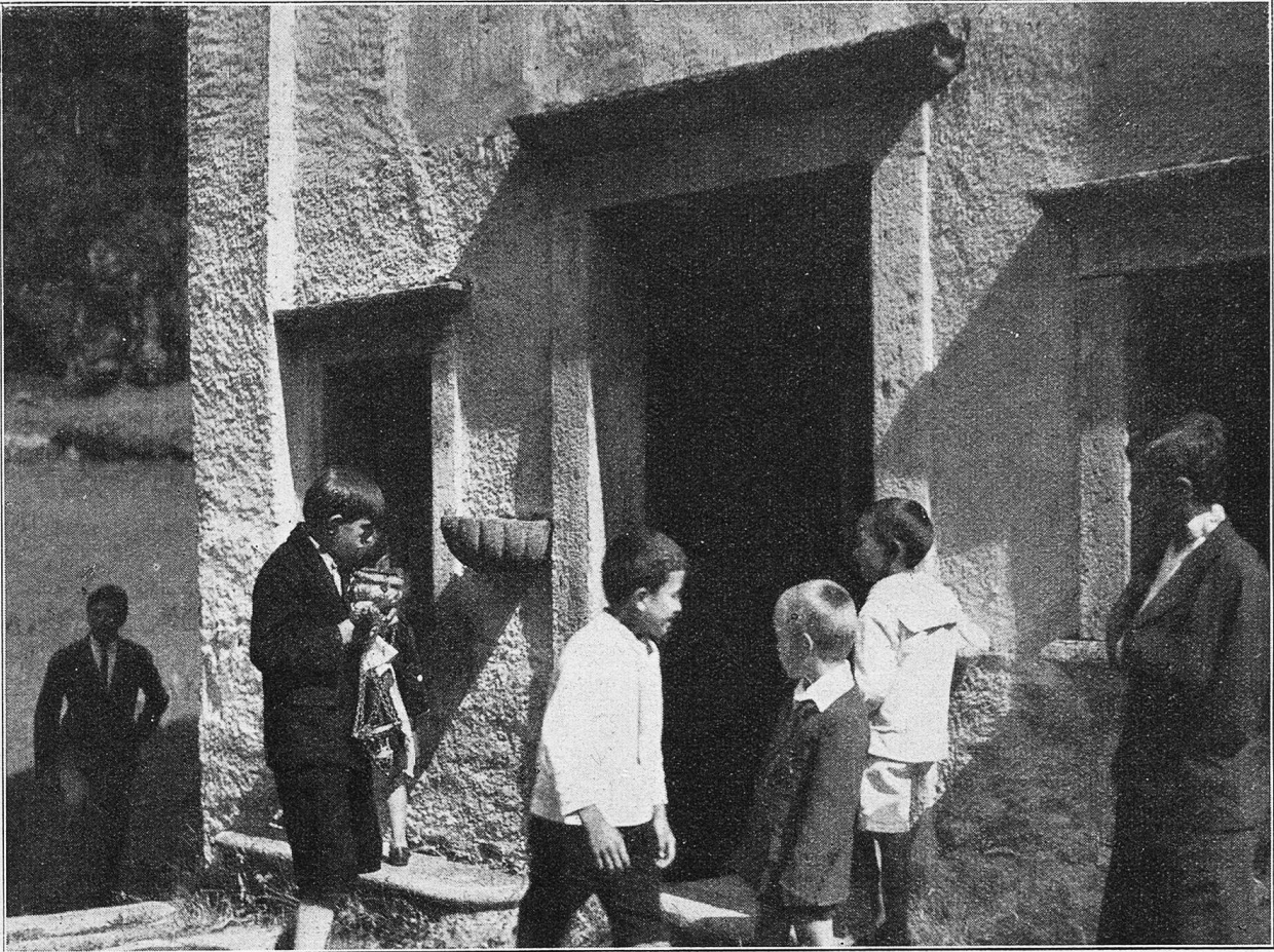
Fest bei der Kapelle „Unserer lieben Frau zum Schnee“, am 5. August.

Der Knabe bringt das Rauchfaß, während in der halbdüsteren Kapelle die Vorbereitungen zur Messe getroffen werden.