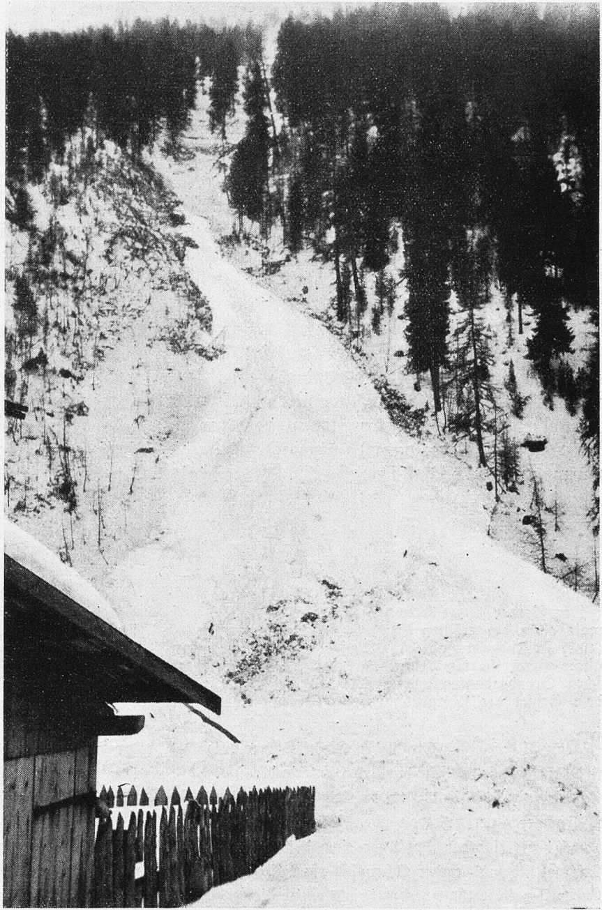
Die Lawinenbahn.

Ich war recht stolz über meinen Aufenthalt auf demjenigen Gebürge, welches die nie versiegende