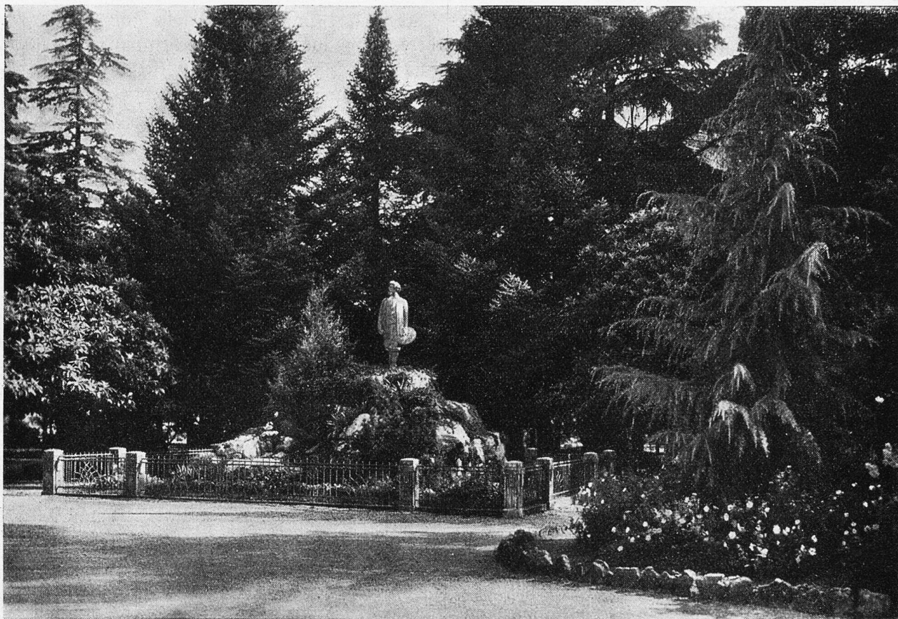
Arco (Trentino). Öffentlicher Garten mit dem Segantini-Denkmal.