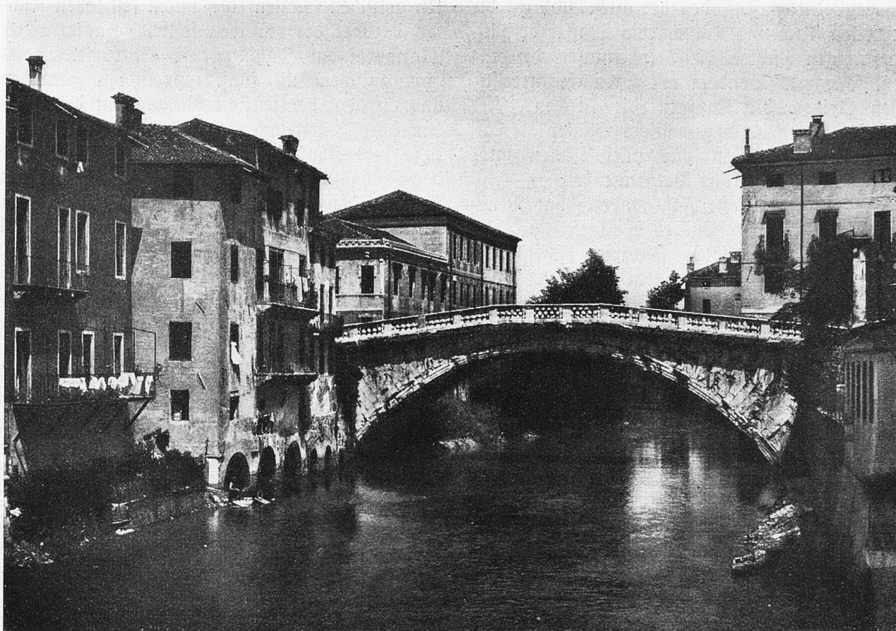
Vicenza. S. Michele-Brücke.

wagen und knatternde Zweirädmotoren. Mit einem schrillen Schrei markieren sie die Kreuzung und pfeilen davon. Am Ziele fragt man sich: sind es wirklich nicht mehr gewesen als 24 Kilometer? Noch länger ist uns die Strecke vorgekommen.