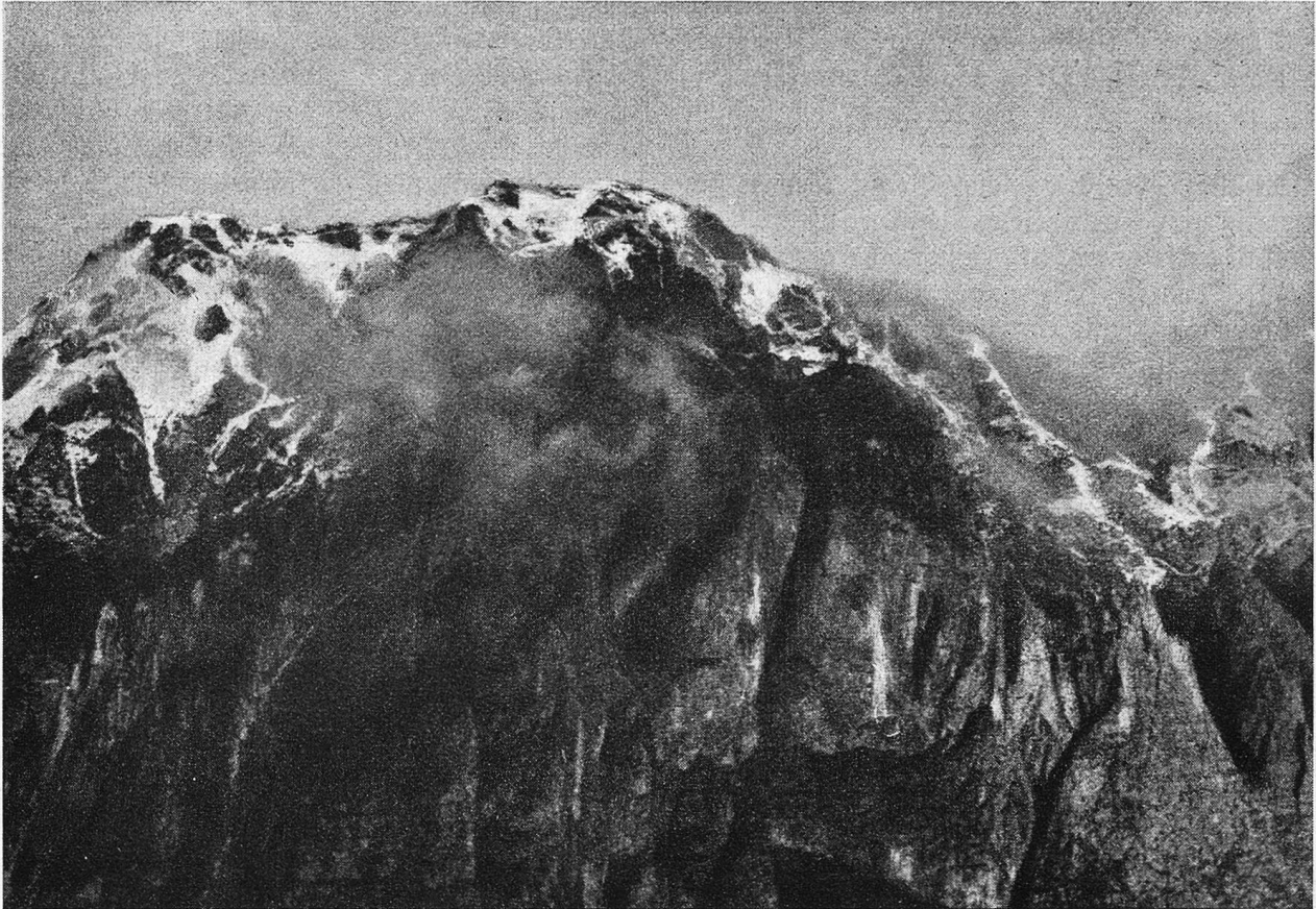
Die Sogli rossi, vom Sacello-Ofario des Pasubio aus.

Lasten. Körbe haben sie an einem Joch über die Achsel gehängt. Sie streben einem Markte zu. Es gilt, ein kärglich Brot zu verdienen.