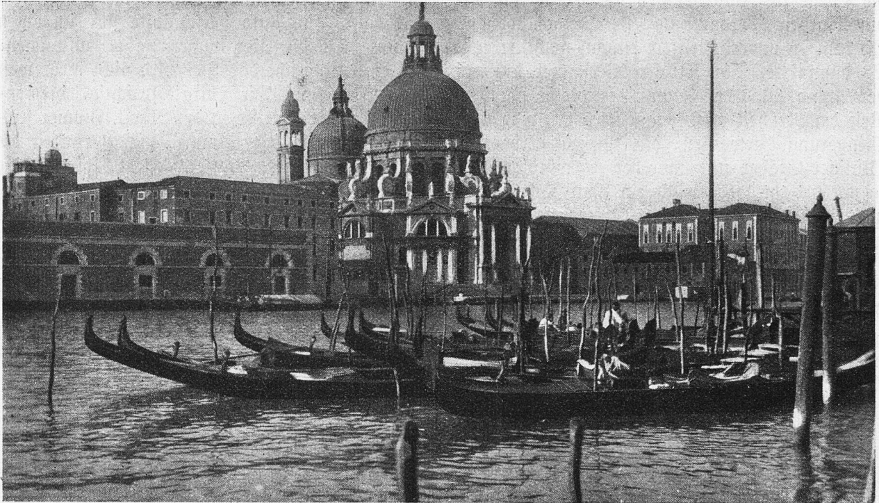
Venedig. Kirche Sta.-Maria della Salute.

Immer mehr bleibt die Stadt mit ihren Türmen im Hintergrund. Im Handumdrehen ist das farbige Uferband des Lido erreicht. Die Badesaison ist noch nicht angebrochen. Aber fremdes Volk tummelt sich schon genug durch die Straßen. Auf dem Weg nach den Strandetablissemmenten tönt es von allen Weltsprachen. Auch waschechtes Berndeutsch ist darunter. Handwerker sind an der Arbeit, in den Hallen die letzten Vorbereitungen zu treffen. Ein frischer Wind kommt übers Meer her. Mit den Tüchern auf den Tischen spielt er wie mit Fahnen. Man bekommt nie genug, von einem geschützten Winkel aus den weißschäumenden Wogen zuzuschauen, wie sie ans Ufer schlagen und zurückrauschen ins Unendliche. Immer neue, immer andere kommen und verschwinden. So geht es auch mit uns, mit allen, ein jedes schwimmt im gewaltigen Rhythmus der Völker mit, Wellen sind wir, werden groß und zerschellen bald am Strande des rätselvollen Lebens. Man sinnt und staunt und möchte die Geheimnisse der wirkenden Kräfte erlauschen. Dabei zerrinnt die Zeit wie der Sand im Wasser.