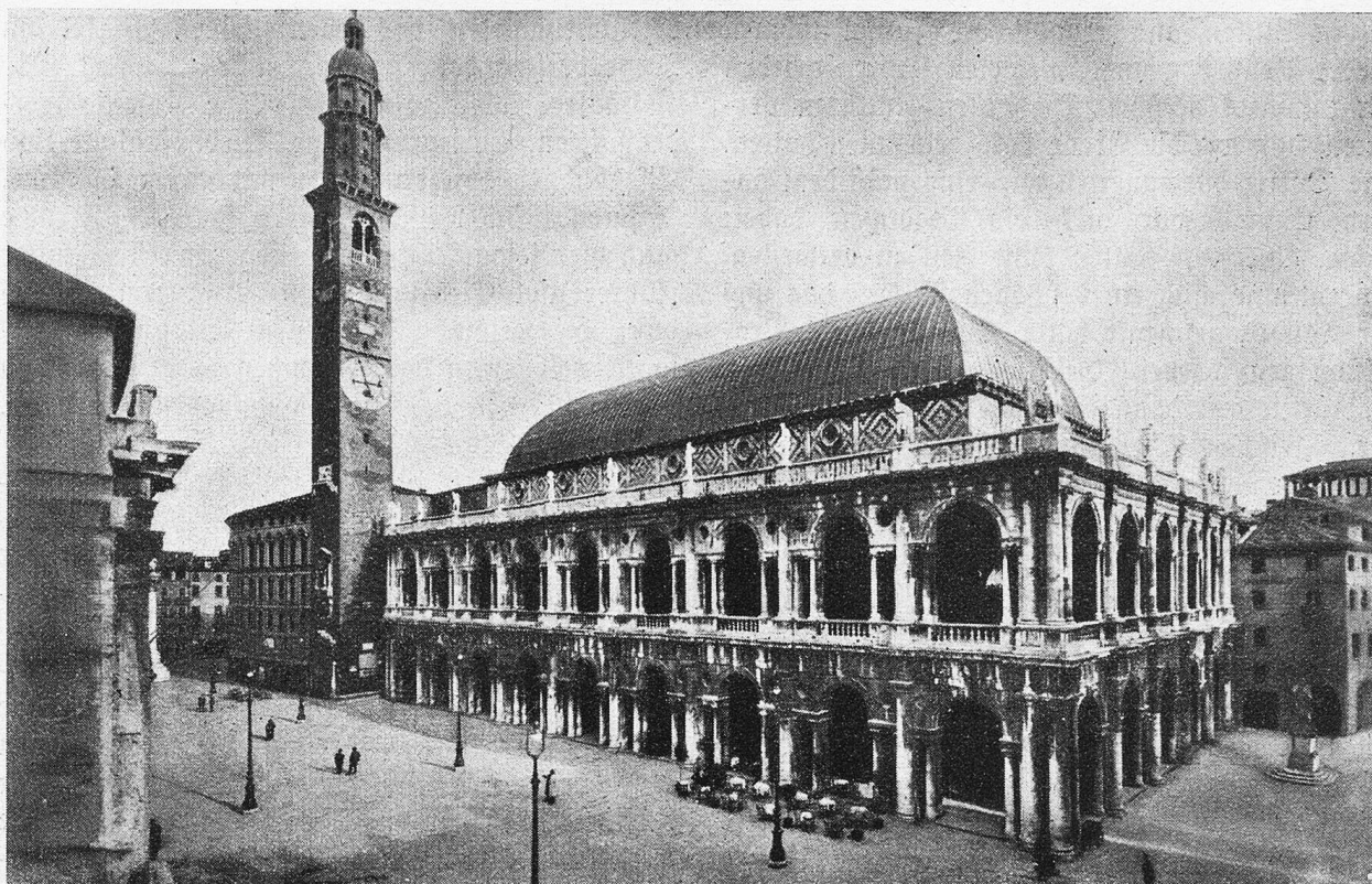
Venedig. Piazza dei Signori. Basilica Palladiana.

Eisenröhrenleitungen wurde die Preßluft von 1000 Meter Höhe auf 2000 Meter gejagt. Und bis für die Mannschaft genügend Wasser herbeigeschafft war! Leitungen von 60 Kilometer Länge waren erstellt worden, elektrische Pumpen schafften es aus der Tiefe herauf.