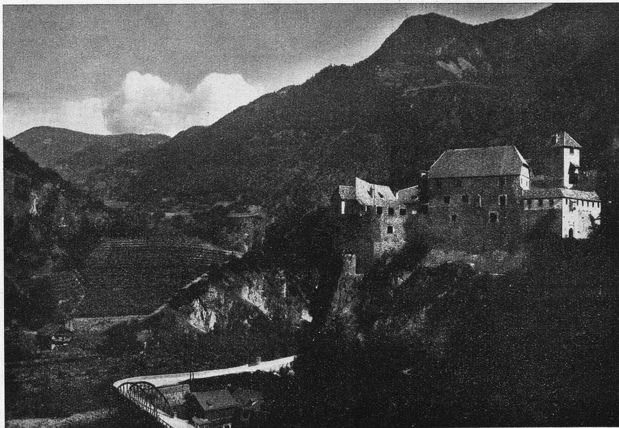
Bozen. Schloß Roncolo.

das Gepäck kommt an die Reihe. Mein Begleiter, der Amerikaner, stieß auf große Schwierigkeiten. Es fehlte ein Schein. Da gab es ein mächtiges Gerede und Suchen und Laufen. Im Koffer wurde das Unterste zuoberst gekehrt. Umsonst! Ob der Weltmann wieder nach Italien zurückgeschickt wurde? Ich befürchtete es. Unterdessen kam auch ich an die Reihe. Auf dem deutschen Posten mußte ich bei Heller und Pfennig meine Reismittel nennen. Zur Bestätigung der gemachten Aussagen verlangte der Beamte noch mehr. Auf dem Schalterbrett kehrte er meine Börse um und schüttelte tüchtig, bis das letzte Metallstück herausgerollt war, Lire, Mark, Schilling und Schweizer Franken. Centesimi, Pfennig, Groschen und Rappen wurden gezählt, und auch eine Schweizer Note durfte passieren, die vorgemerkt war. Ich dachte an die gute alte Zeit, da man noch ohne Paß durch Europa reiste und kein Mensch einem in die Brieftasche guckte.