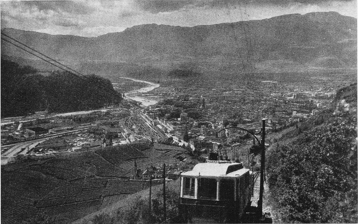
Bahn auf den Ronen. Blick auf Bozen.

große Rätsel weiter, das unsern Herzschlag bestimmt. Auf ein Stündchen schaute ich auch gern in ein Buch; zwischenhinein guckte ich nach den winterlichen Bergen und schüttelte den Kopf über den unbegreiflichen Sommer, der die Weltenuhr im Wandel der Jahreszeiten so sehr in Verwirrung brachte. Freilich, ich durfte mir sagen, am Gardasee eine Sonneninsel getroffen zu haben im Vergleich zu den unwirtlichen nördlicheren