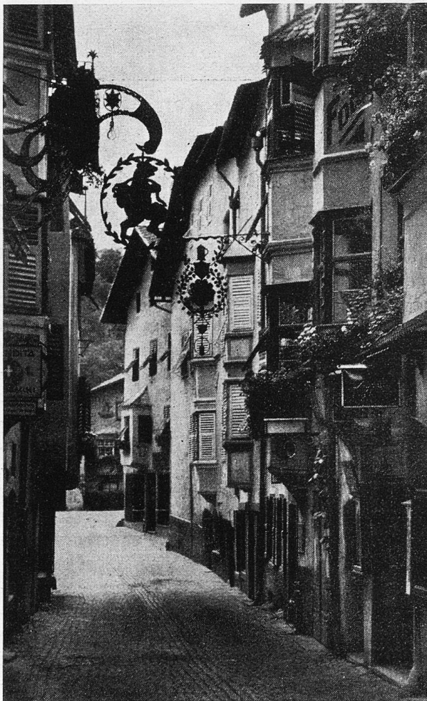
Klausen am Brenner.

Ein mächtiges Leben pulste durch die Gassen. Es war ja Sonntag. Von allen Seiten hatten