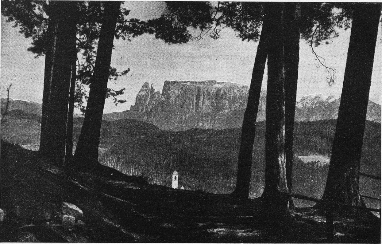
Der Renon gegen den Scillior der Dolomiten.

und erfuhr, daß ich am gewünschten Ziele stand. Meine Grüße aus Zürich öffneten mir Tür und Tor des gastlichen Hauses. Ich wurde in die gute Stube hinaufkomplimentiert. Alsobald saß ich hinterm Tisch, und die Flasche Eigengewächs stand auch schon vor mir. Der St. Justiner ist ein guter, kernhafter Tropfen von Gehalt und einem Geschmack, den der Kenner schätzt. Voll, erdgebunden, nicht leicht, möchte ich sagen, und man glaubt ihm, daß die Sonne so fleißig die blauen Beeren gekocht hat.