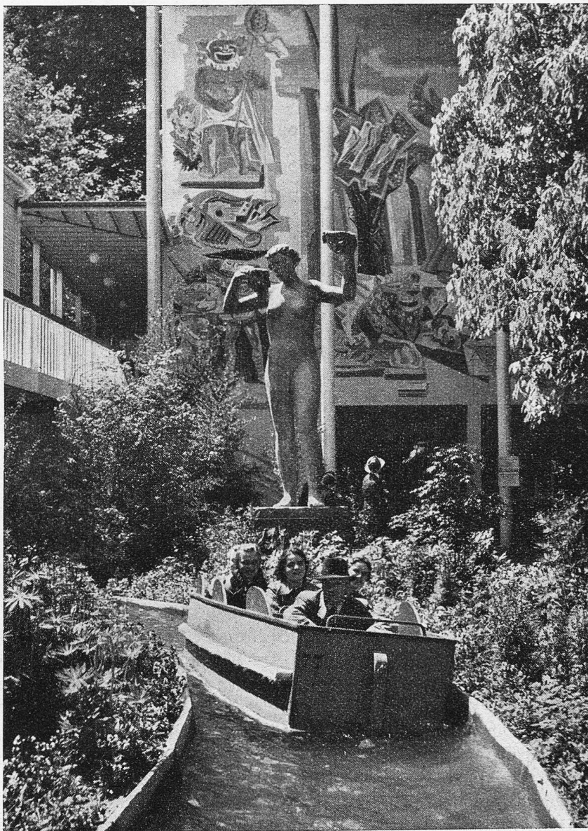
Schweiz. Landesausstellung. Auf dem Schiffliabach.

Der erste Sommer unserer Luftschifferei schloß wegen der Erkrankung Bigs, die mich mit dunklen Gedanken beunruhigte, nicht so harmonisch, wie ich hatte erwarten dürfen, aber der Kunstwinter in Venedig, Florenz und Rom verfloß uns wie