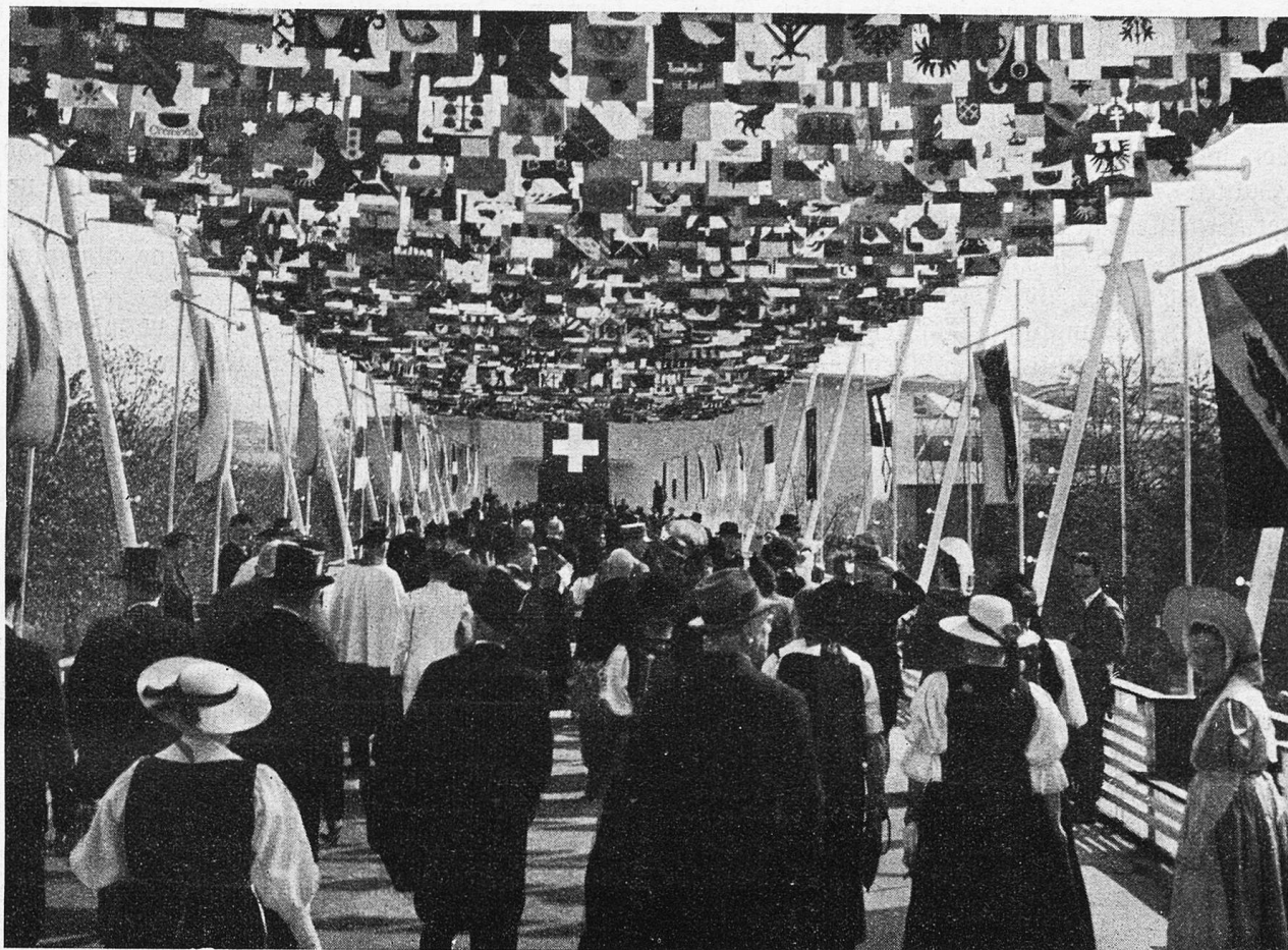
Schweiz. Landesausstellung. Die Gemeindewappen auf der Höhenstraße.