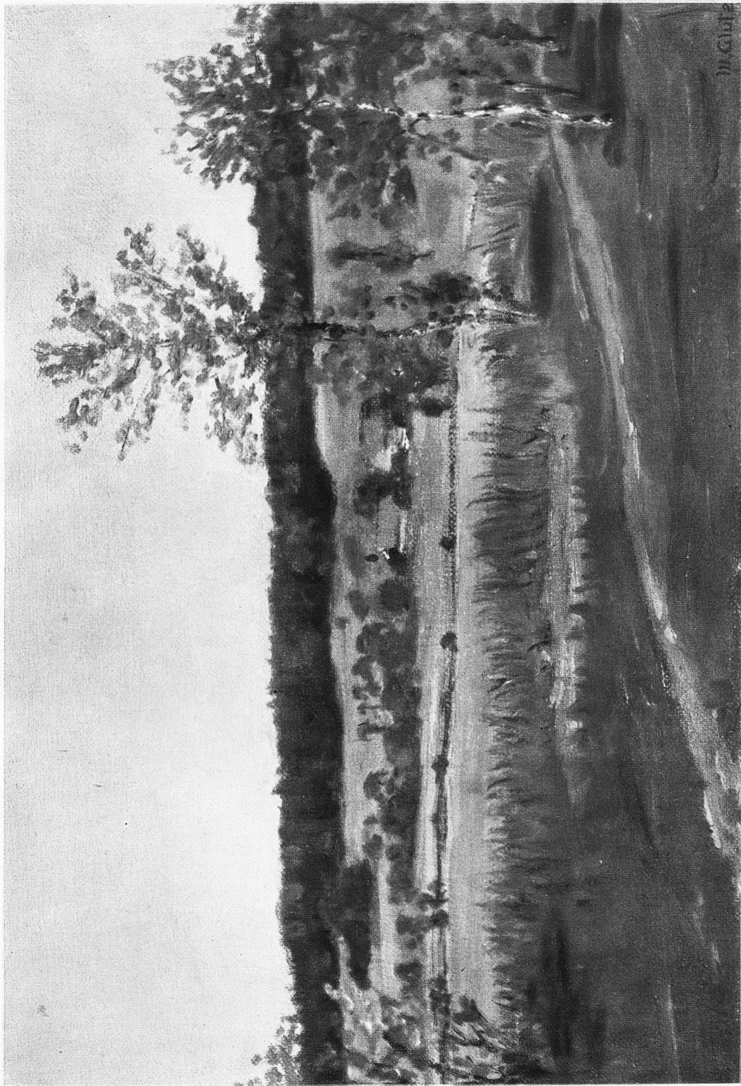
W. Gutz: „Am Rasthof“