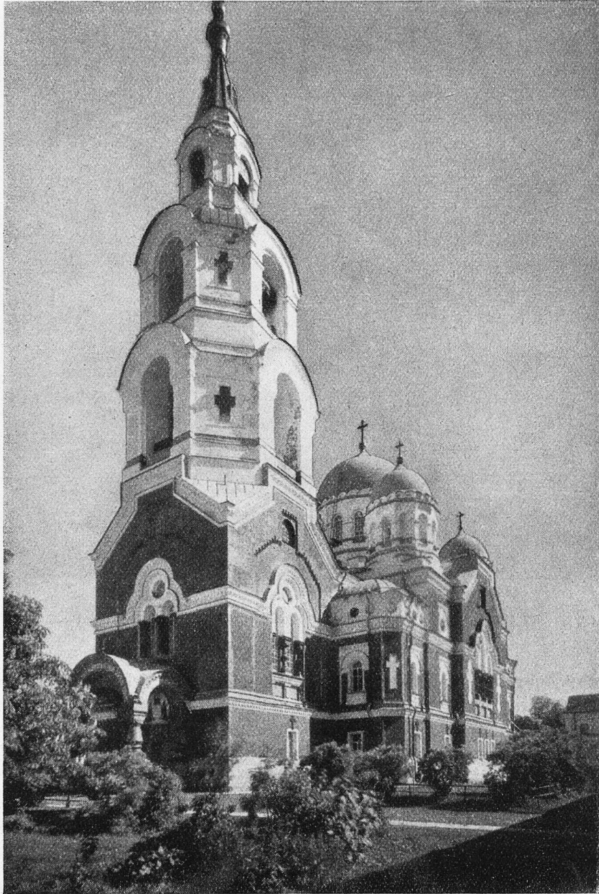
Die Kirche Christi in Valamo am Ladogasee (Finnland).

ein Zufall den Mönchen, die hier lebten, ihr Dasein, erhielt sich das Kloster und seine Vielzahl herrlicher Anlagen.