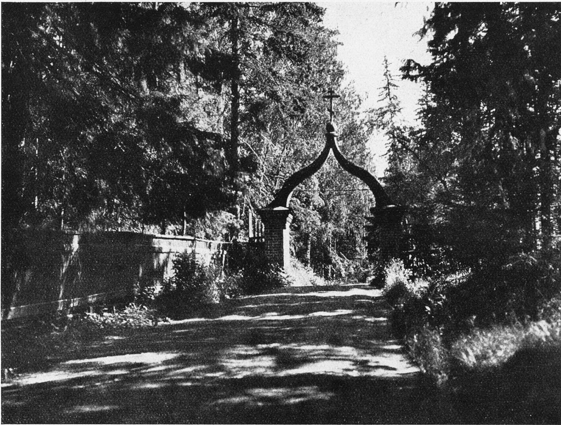
Der Eingang in das romantische Kloster von Valamo (Finnland).