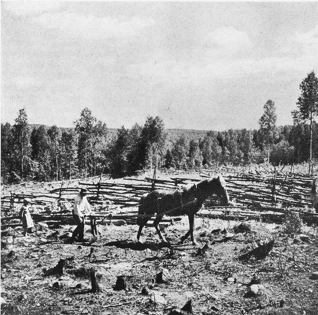
Zum erstenmal geht der Pflug durch das in Rodung befindliche Land. Auf diese Weise wird in Finnland jahraus jahrein neuer Kulturboden gewonnen.