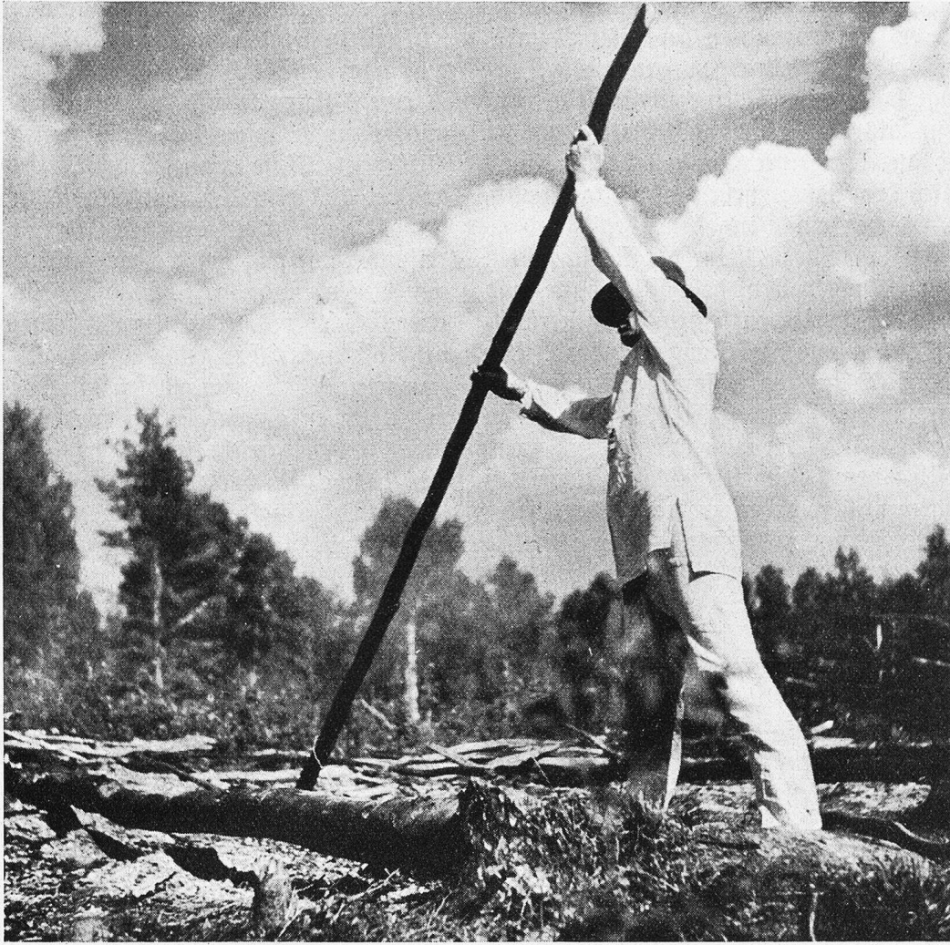
Dieser Finne ist daran, in dem Schwendland Wurzelstöcke und größere Steine mit einer Stange aus dem Boden herauszutuchten.