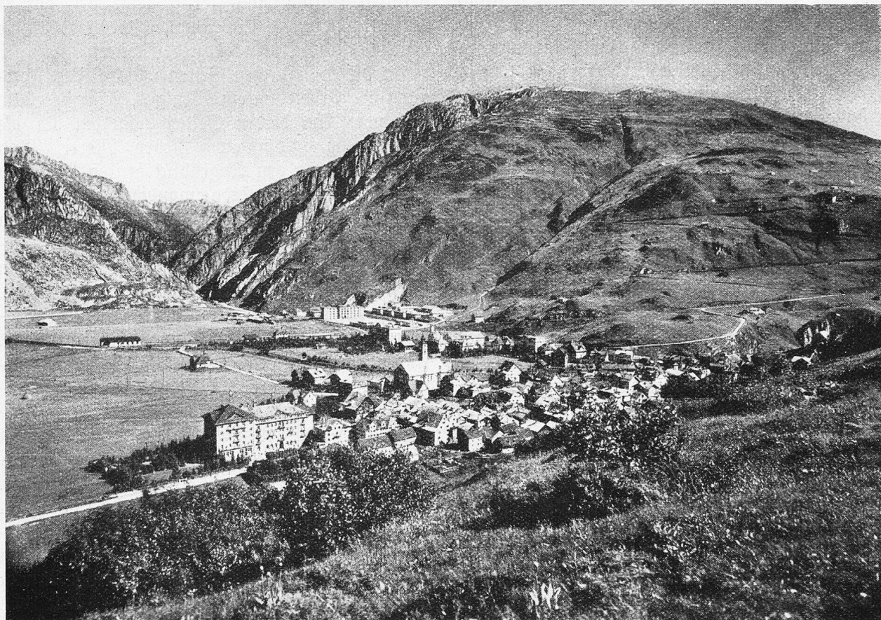
Andermatt gegen die Schöllenen und Oberalp.