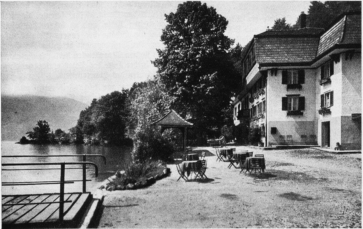
Kurhaus Baumgarten bei Immensee.

geöffnet war, blühte es mit einem Mal. Die Birn- und Apfelbäume hatten es so eilig, daß sie nicht hinter den Kirschbäumen zurückstehen wollten. So ging es an ein Wettfeiern und Wettblühen landauf und -ab, und der Freund so bezaubernder