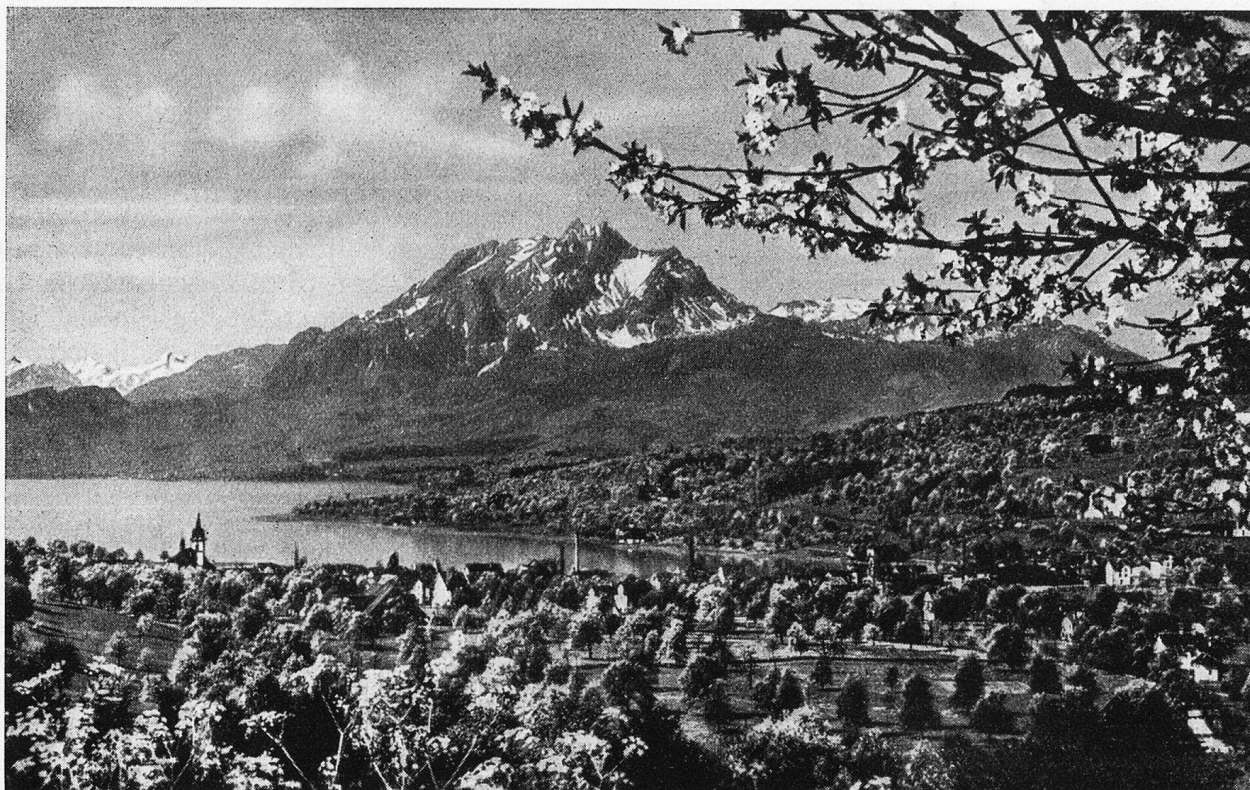
Rüschnacht a. Rigi mit Pilatus.

Weglein dem Riemen nach nicht. Ich seh' ihm an, daß es mich beglücken wird.