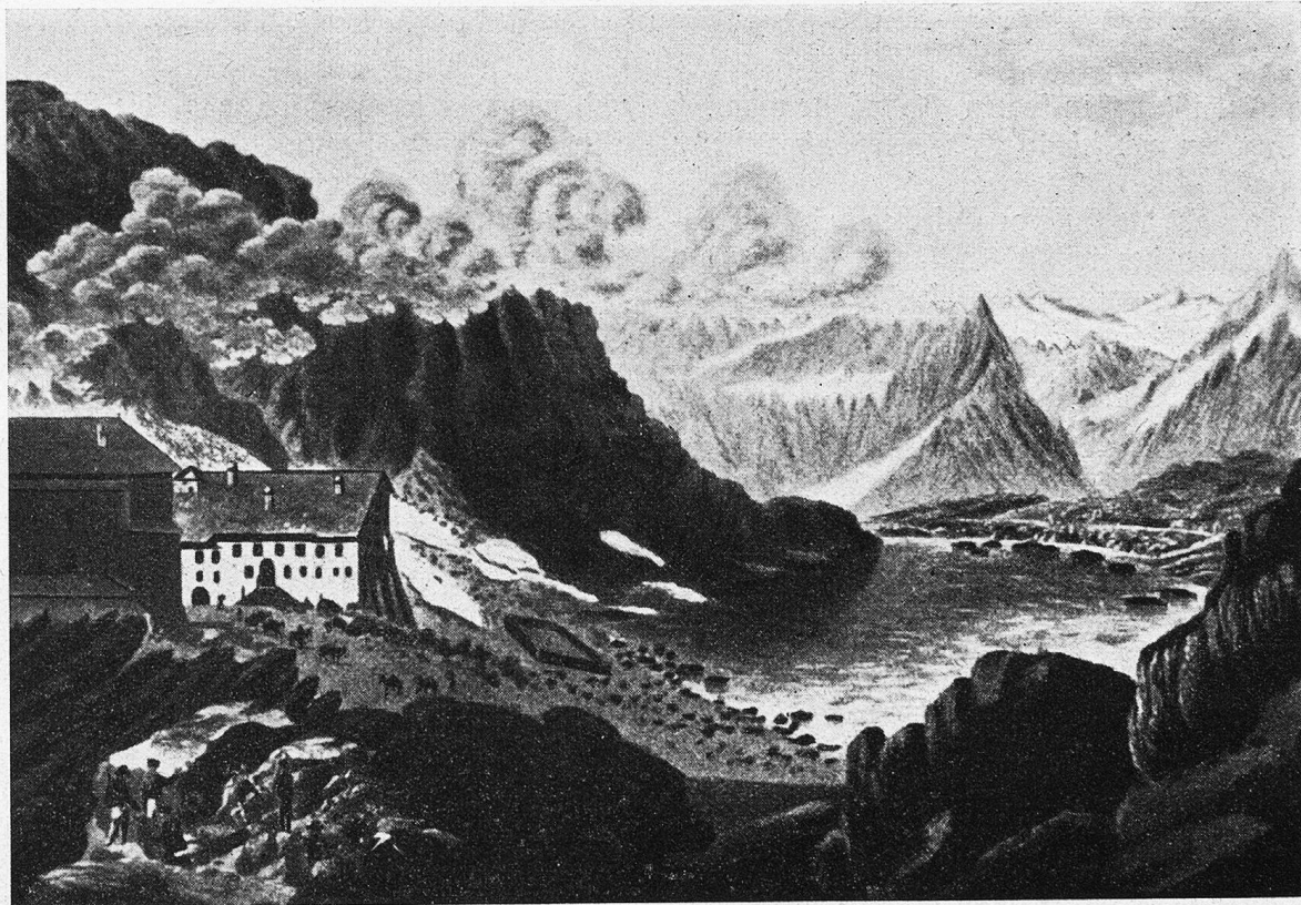
Der Große St. Bernhard. Handkolorierter Stich von J. G. Weibel, 1771—1846.

innere Bindung zur Bergwelt entstand dadurch freilich nicht; niemals suchte sie der Mensch des Altertums zu seinem Vergnügen auf, stets befangen von einer heiligen Scheu vor dem Übernatürlichen, den Geistern und Göttern, die dort